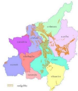
ภาพที่ ๓ พื้นที่ปฏิรูปที่ดิน จังหวัดพิษณุโลก

พื้นที่ปฏิรูปที่ดินและผลการจัดที่ดิน ณ วันที่ ๒ มิถุนายน ๒๕๖๕ พื้นที่ประกาศเขตฯ จำนวน ๖๑๒,๗๒๔ ไร่ พื้นที่ RF หลัง พรฎ. ๑๑,๖๖๖.๙๘ ไร่ พื้นที่กันออก ๑๖๘,๗๙๙.๗๑ ไร่ พื้นที่ดำเนินการ ๔๔๓,๙๒๔.๒๙ มอบ ส.ป.ก.๔-๐๑ ที่ดินเกษตรกรรม จำนวน ๒๒,๘๑๕ ราย ๓๑,๙๑๖ แปลง ๔๐๐,๗๙๕ ไร่ ที่ดินชุมชน ๗,๙๖๕ ราย ๘,๙๖๕ แปลง ๗,๑๐๒ ไร่ รายละเอียดตามตาราง