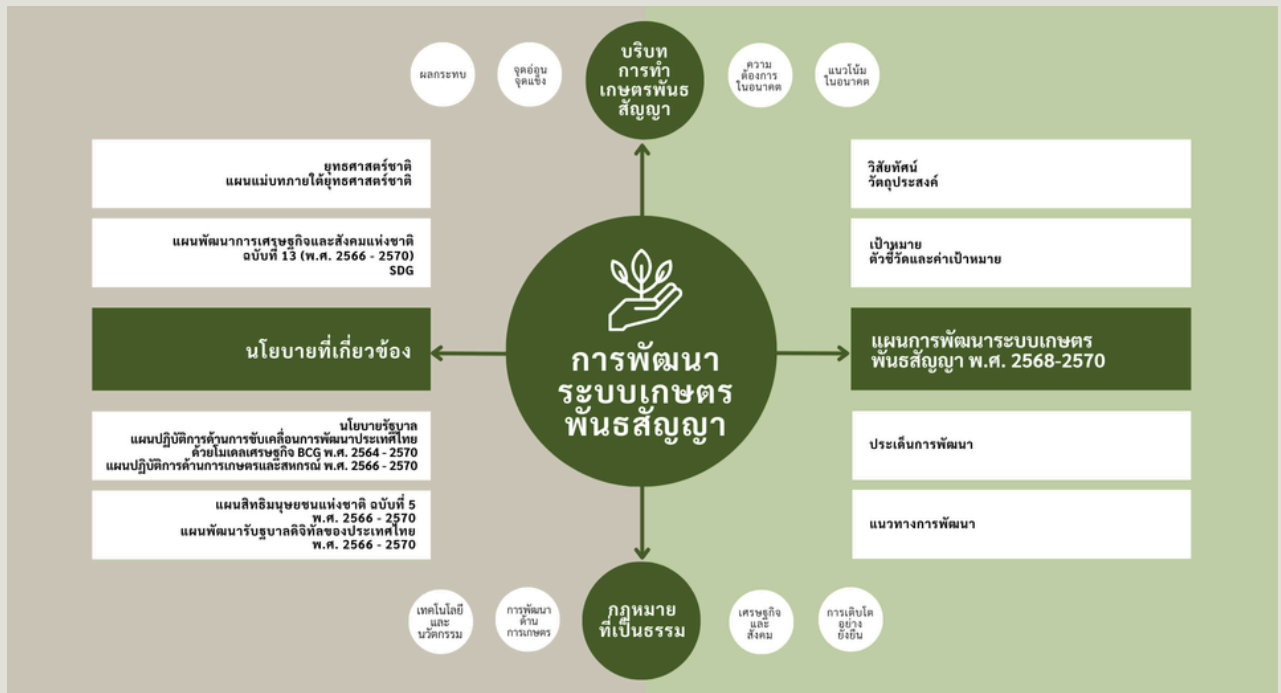
กรอบแนวคิดการจัดทำแผนแผนการพัฒนาระบบเกษตรพันธสัญญา พ.ศ. 2568 - 2570