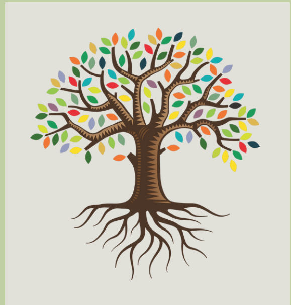
เจตนารมณ์ของ พ.ร.บ.เกษตรพันธสัญญา