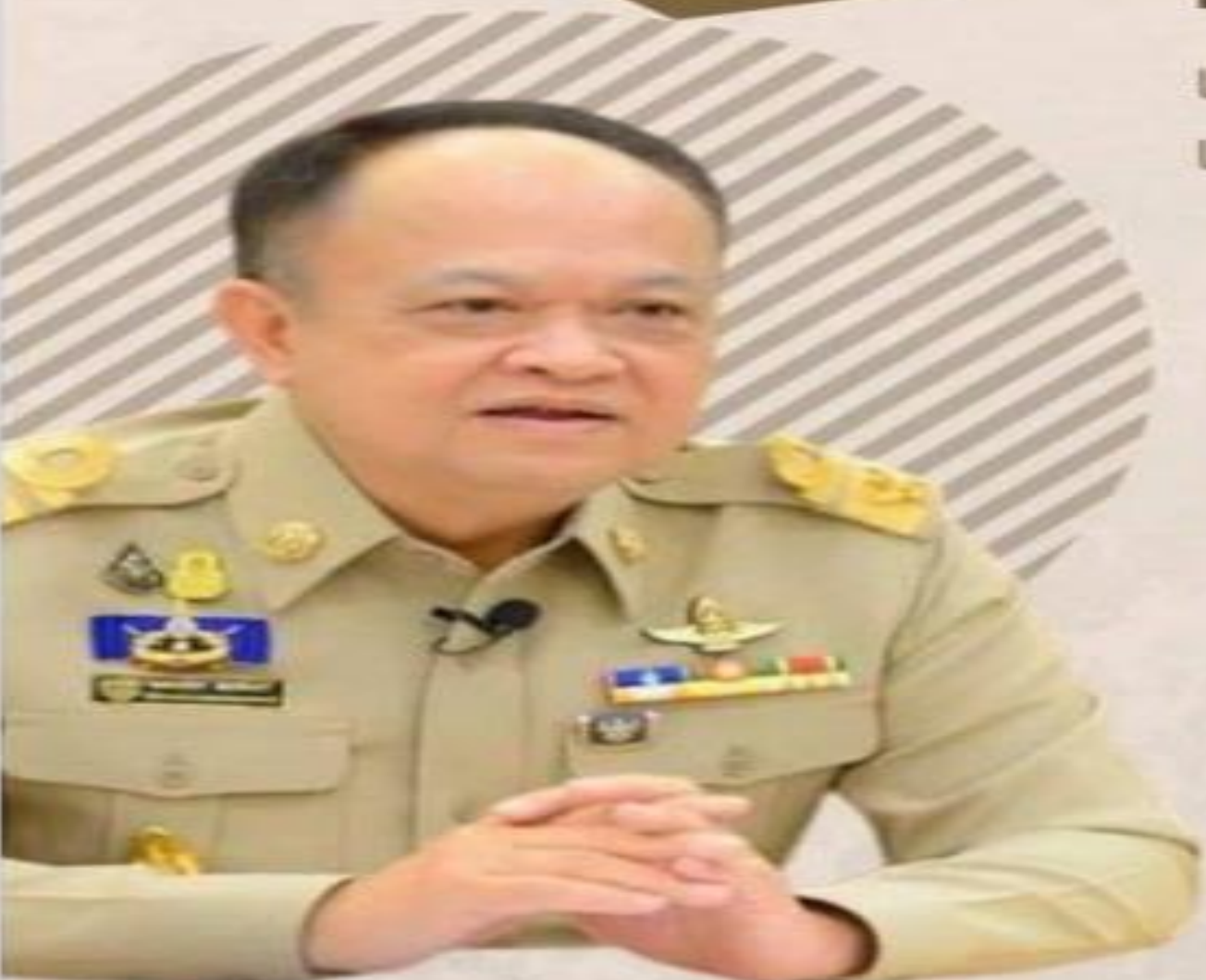
ดร.ทองเปลว กองจันทร์ ปลัดกระทรวงเกษตรและสหกรณ์