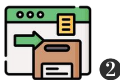
บันทึกข้อมูล ในแบบฟอร์ม