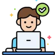
ผู้ประกอบธุรกิจ หรือผู้แทน