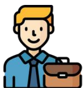
ผู้ประกอบธุรกิจ หรือผู้แทน