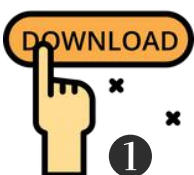
ดาวน์โหลด แบบฟอร์ม