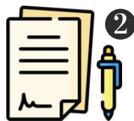
กรอกข้อมูล พร้อมเอกสารประกอบ