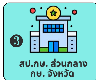
สป.กษ. ส่วนกลาง กษ. จังหวัด