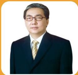
ประธานกรรมการ นายสมคิด จาตุศรีพิทักษ์ รองนายกรัฐมนตรี