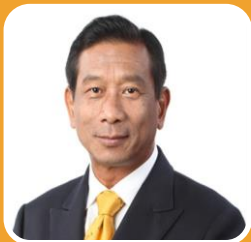
รองประธานกรรมการ พลเอกฉัตรชัย สาริกัลยะ รัฐมนตรีว่าการกระทรวงเกษตรและสหกรณ์