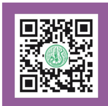
ส่วนที่ 4 แบบฟอร์ม