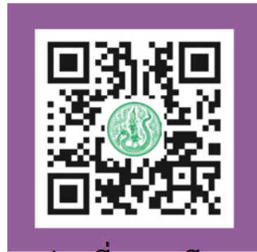
ส่วนที่ 5 ระเบียบ ประกาศ คำสั่ง มติ