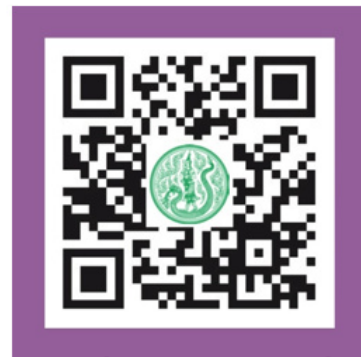
ส่วนที่ 2 คู่มือรับเรื่อง