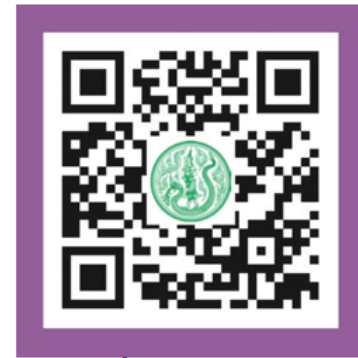
ส่วนที่ 6 ภาคผนวก