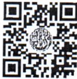
ระเบียบฯ ว่าด้วยงานสารบรรณ (รายงานการประชุม)

จากการชักข้อประเด็นนี้ในปีก่อน พบว่า อบก. ส่วนจังหวัด และ อบก. ส่วนอำเภอ ส่วนใหญ่ ได้ดำเนินการในประเด็นนี้แล้ว แต่ยังมี อบก. บางส่วนที่ยังคงระบุครั้งที่ในรายงานการประชุม โดยเรียงจำนวนครั้งตามปีงบประมาณ ซึ่งไม่เป็นไปตามระเบียบสำนักนายกรัฐมนตรี ว่าด้วยงานสารบรรณ พ.ศ. ๒๕๒๖ และที่แก้ไขเพิ่มเติม ทั้งนี้ สามารถดูรายละเอียดเพิ่มเติมได้ตาม QR code นี้