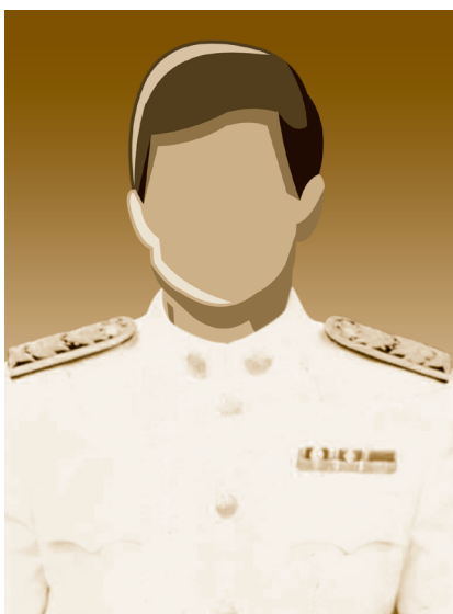
เครื่องแบบพิธีการ