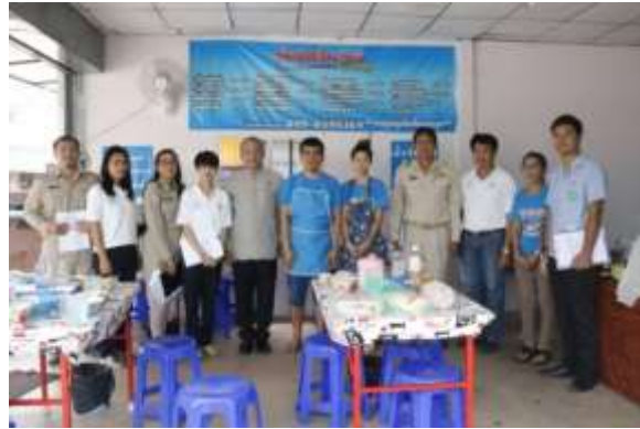
ร้าน พารวย ก๋วยเตี่ยวหม้อไฟอินดี้