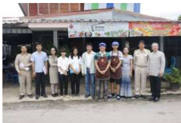
ร้านคุณแจ้วก๋วยจั๊บน้ำจืด