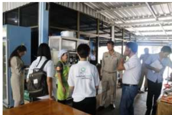
ร้านอาหารชาวเลย