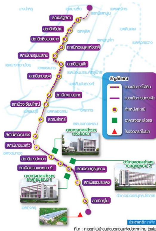
ภาพที่ 3 โครงการรถไฟฟ้าสายสีม่วง ช่วงเตาปูน-ราชภัฏบุรีรัมย์ (วงแหวนกาญจนาภิเษก)