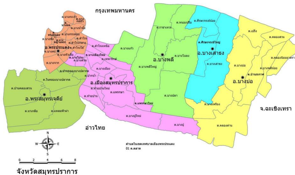
ภาพที่ 1 แผนที่จังหวัดสมุทรปราการ