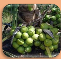
สินค้าเด่น/GI

มะพร้าวน้ำหอมบ้านแพ้ว มะพร้าวน้ำหอมพันธุ์ต้นเดียว ผลมีลักษณะกลมรี เหมือนหัวลิง และกันมีจีบ เป็นพู 3 พู ชัดเจน เปลือกสีเขียว เนื้อมะพร้าวเหนียวนุ่ม น้ำมะพร้าวมีรสหวานและกลิ่นหอมคล้าย ใบเตย ปลูกครอบคลุมพื้นที่ 3 อำเภอ ได้แก่ อำเภอบ้านแพ้ว อำเภอกระทุ่มแบน และอำเภอมืองสมุทรสาคร