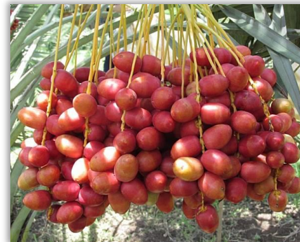
อินทผลัม