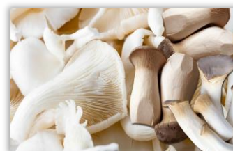
เห็ด ชนิดต่าง ๆ