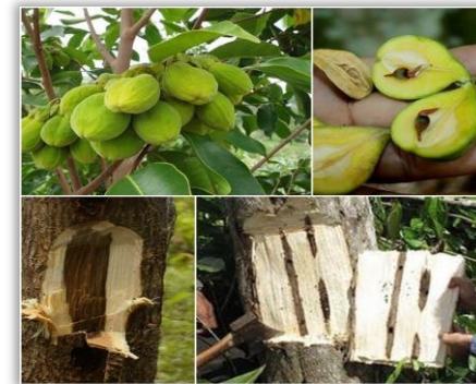
ไม้กฤษณา