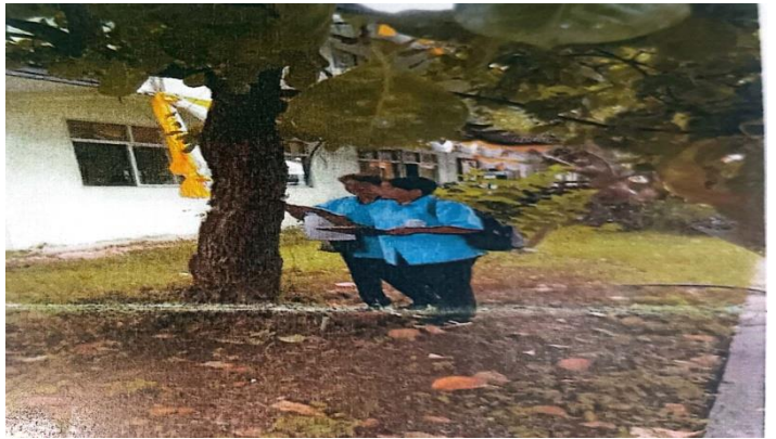
โครงการอนุรักษ์พันธุกรรมพืชอันเนื่องมาจากพระราชดำริสมเด็จพระกนิษฐาธิราชเจ้า กรมสมเด็จพระเทพรัตนราชสุดาฯ สยามบรมราชกุมารี (กิจกรรมงานที่ ๑ งานปลูกปักษีวิทยากรท้องถิ่น) ปี พ.ศ. ๒๕๖๓