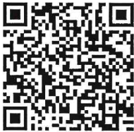
Songkran - English version