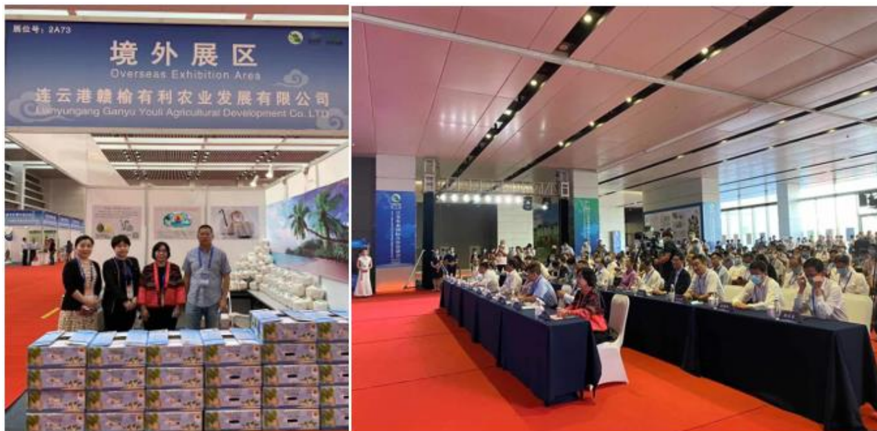
งาน 22 nd Jiangsu International Agri Expo 2020 ณ เมืองเหลียงยูนกว่าง มณฑลเจียงซู

เป็นงานแสดงสินค้าเกษตรนานาชาติที่จัดขึ้นเป็นประจำทุกปี แต่ปีนี้รูปแบบการจัดงาน มีทั้งรูปแบบออฟไลน์และออนไลน์ผ่านสื่อ social media ชื่อดังของจีน 5 แพลตฟอร์ม คือ Weibo Tiktok Wechat และ Dingding ภายในงานมีการจัดแสดงสินค้าเกษตรมากกว่า 4,000 ชนิด เช่น ข้าวสาร ผักผลไม้ น้ำมัน เนื้อสัตว์ สินค้าประมงและเครื่องจักรกลการเกษตร จาก 20 กว่าประเทศเข้าร่วมงาน