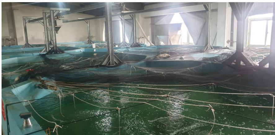
ภายในศูนย์วิจัยการเพาะเลี้ยงสัตว์น้ำ ณ เมืองหรงตง มณฑลเจียงซู

เมื่อวันที่ 17 มกราคม 2563 ฝ่ายเกษตรฯ ศึกษาดูงานระบบน้ำหมุนเวียนเพื่อการเพาะเลี้ยงสัตว์น้ำ ณ ศูนย์วิจัยการเพาะเลี้ยงสัตว์น้ำ เมืองหรงตง ซึ่งเป็นศูนย์ทดลองระบบน้ำหมุนเวียนเพื่อการเพาะเลี้ยงสัตว์น้ำชายฝั่ง-น้ำจืดอัจฉริยะของ FMIRI โดยนำเทคโนโลยีและอุปกรณ์ประมงที่ถูกคิดค้นขึ้นมาใหม่มาใช้ทดลองก่อนนำไปเผยแพร่ให้กับชาวประมงเช่น เครื่องให้อาหารอัตโนมัติ เซนเซอร์ควบคุมอุณหภูมิ เครื่องเพิ่มออกซิเจนและระบบกรองของเสีย (Filter) ภายในศูนย์วิจัยฯ หรงตงมีการเพาะเลี้ยงปูม้า กุ้งกุลาดำ ปลาสเตอร์เจียน ปลาเซลมอนและปลาทองถิ่น