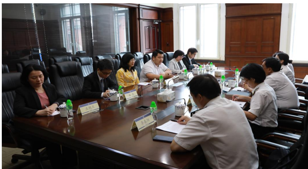
กงสุลใหญ่ ณ นครเซี่ยงไฮ้ ฝ่ายเกษตรฯ และ สำนักงานส่งเสริมการค้าระหว่างประเทศ เข้าพบหารือกับกรมศุลกากรเซี่ยงไฮ้

เมื่อวันที่ 10 กรกฎาคม 2563 กงสุลใหญ่ ณ นครเซี่ยงไฮ้ ฝ่ายเกษตรฯ และ สำนักงานส่งเสริมการค้าระหว่างประเทศ เข้าพบรองอธิบดีกรมศุลกากรเซี่ยงไฮ้และเจ้าหน้าที่ที่เกี่ยวข้อง ซึ่งนับตั้งแต่ปี พ.ศ. 2551 กรมศุลกากรจีนได้ใช้ระบบยื่นเอกสารออนไลน์ โดยผู้นำเข้าจีนยื่นเอกสารล่วงหน้าผ่านระบบ เมื่อของมาถึงด่านฯ เจ้าหน้าที่จะทำการสุ่มตรวจและปล่อยสินค้า หลังจากนั้นจะแจ้งผลให้ผู้นำเข้าทราบและมารับสินค้าต่อไป ในส่วนสินค้าเกษตรไทยไม่ค่อยพบปัญหาใหญ่ที่ต้องถึงขั้นระงับการนำเข้าหรือส่งสินค้ากลับ โดยปัญหาหลักที่ตรวจพบในสินค้าเกษตรไทยคือแมลงศัตรูพืช แต่อย่างไรก็ตาม กรมศุลกากรจีนไม่ได้มีข้อมูลเผยแพร่เกี่ยวกับค่ามาตรฐานสารตกค้างในสินค้าเกษตรและประมงนำเข้าอย่างสาธารณะ ดังนั้น ผู้ส่งออกไทยจะต้องประสานผู้นำเข้าจีน เพื่อตรวจสอบข้อมูลก่อนการส่งออกสินค้าก่อนเสมอ เพื่อหลีกเลี่ยงปัญหาการตรวจพบสารตกค้าง ที่ทำให้สินค้าอาจถูกตีกลับหรือทำลาย