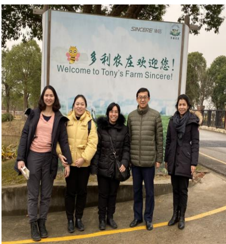
ฝ่ายเกษตรฯ เข้าพบหารือกับบริษัท Tony Farm

เมื่อวันที่ 6 มกราคม 2563 ฝ่ายเกษตรฯ เข้าเยี่ยมชมฟาร์มเกษตรอัจฉริยะและเกษตรอินทรีย์ของบริษัท Tony Farm ซึ่งบริษัท Tony Farm เป็นฟาร์มเกษตรอินทรีย์อัจฉริยะขนาดใหญ่ที่สุดในเซี่ยงไฮ้ มีขนาดประมาณ 426 ไร่ ภายในฟาร์มมีระบบการจัดการที่เน้นคำนึงถึงการรักษาสิ่งแวดล้อมเป็นสำคัญ เช่น อาคารภายในฟาร์มถูกดัดแปลงมาจากตู้คอนเทนเนอร์เก่า มีการออกแบบให้รับแสงอาทิตย์ลดการใช้พลังงานไฟฟ้า เครื่องจักรจับแมลงที่รับพลังงานแสงอาทิตย์ผ่านแผงโซลาร์เซลล์ อีกทั้งการดำเนินงานภายในฟาร์มเคร่งครัดตามหลักเกษตรออร์แกนิก นอกจากนี้ บริษัทฯ มีลูกค้าประจำในการสั่งซื้อสินค้าผักเกษตรอินทรีย์ และสินค้าที่ถูกส่งไปยังผู้บริโภคจะมี QR Code ที่สามารถตรวจสอบได้ว่า สินค้าผ่านการรับรองจากหน่วยงานที่เกี่ยวข้องกับเกษตรอินทรีย์