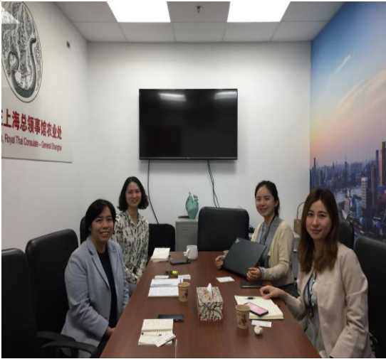
บริษัท Shanghai Jiuye Supply Chain Management จำกัด เข้าพบและหารือเกี่ยวกับ สถานการณ์การผลิตมะพร้าวน้ำหอม ของประเทศไทย

เมื่อวันที่ 18 ธันวาคม 2562 บริษัท Shanghai Jiuye Supply Chain Management จำกัด เข้าพบฝ่ายเกษตรฯ และประชุมหารือเกี่ยวกับสถานการณ์การผลิตมะพร้าวน้ำหอมของประเทศไทย โดยบริษัทที่ดำเนินธุรกิจเกี่ยวกับการซื้อขายสินค้าเกษตรและอาหารผ่านแพลตฟอร์มออนไลน์ และบริการขนส่งสินค้าออนไลน์อย่างครบวงจร อีกทั้งบริษัทเป็นผู้นำเข้ามะพร้าว น้ำหอมของอำเภอดำเนินสะดวก จังหวัดราชบุรี ภายใต้สัญลักษณ์ตราสินค้า “Wefresh” ซึ่งผลผลิตมะพร้าว น้ำหอมของอำเภอดำเนินสะดวกมีจำนวนจำกัด แต่ผู้ประกอบการไทยและต่างประเทศมีความต้องการเป็นอย่างมาก ทำให้บริษัทไม่ขาดแคลนมะพร้าว น้ำหอมเข้ามาจำหน่ายในประเทศจีน