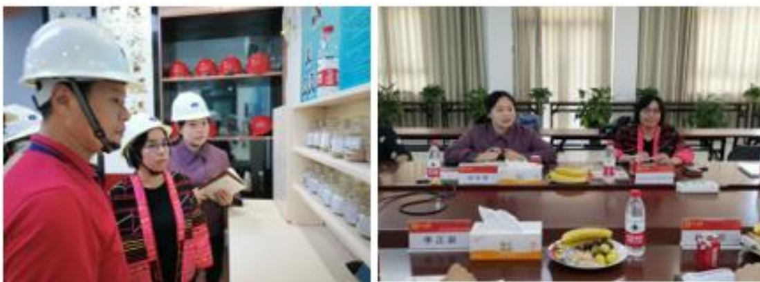
ฝ่ายเกษตรกรฯ เข้าประชุมหารือกับ บริษัท Charoen Pokphong Group (CP Group) และเยี่ยมชมโรงงานแปรรูปอาหารสัตว์ในมณฑลอานฮุย

บริษัท Charoen Pokphong Group (CP Group) มีบริษัทลูกในเครือ 600 แห่งในทุกมณฑลของจีน ยกเว้นทิเบต ดำเนินธุรกิจอย่างครอบคลุมทุกด้าน ทุกมณฑลจะมีบริษัทย่อยที่รับผิดชอบและมีหน้าที่ในการดำเนินธุรกิจที่แตกต่างกัน สำหรับธุรกิจภาคเกษตร บริษัทมีสาขาย่อยรับผิดชอบตั้งแต่การเพาะเมล็ดพันธุ์จนถึงการจำหน่ายสินค้าเกษตร ทั้งนี้ บริษัท CP มีโรงงานแปรรูปอาหารสัตว์ในมณฑลอานฮุย 3 แห่ง คือ เมืองเหอเฟย์ เมืองอู่หู และเมืองฉูโจว รับผิดชอบผลิตอาหารสัตว์ 8 ชนิด ได้แก่ หมู เป็ด ไก่ ห่าน นกกระทา ปลา กุ้งและปู ทั้งในรูปแบบอาหารเม็ดและผง โดยโรงงานทั้ง 3 แห่ง มีกำลังผลิตอาหารสัตว์มากกว่า 8 แสนตันต่อปี ซึ่งโรงงานหลักอยู่ที่เมืองเหอเฟย์ มีแรงงานเพียง 30 คนในสายการผลิต แต่สามารถผลิตอาหารสัตว์ได้ 5 แสนตันปี เนื่องจากโรงงานแห่งนี้ใช้ระบบเทคโนโลยีการเกษตรอัจฉริยะเข้ามาดำเนินการผลิต มีการใช้ระบบเซนเซอร์ เครื่องหุ่นยนต์อัตโนมัติ โดยใช้ระบบการควบคุมทางไกล