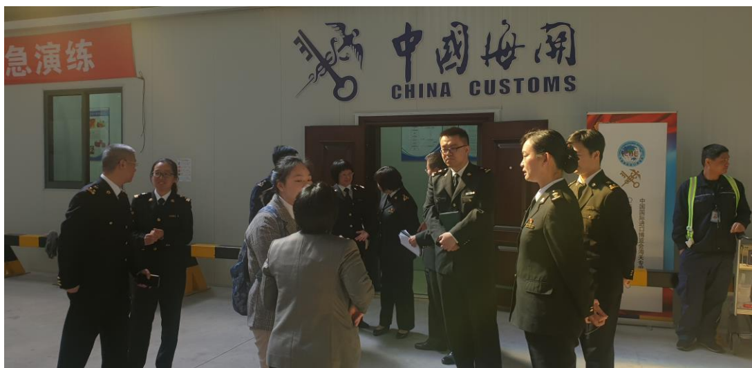
ฝ่ายเกษตรฯ เข้าเยี่ยมคารวะศุลกากรจีน เขต สนามบินนานาชาติผู้ตง

ขั้นตอนทั่วไปในการนำเข้าสินค้าเกษตรโดยทั่วไปมี 3 ขั้นตอนหลักคือ 1) สินค้าที่ประเทศคู่ค้าต้องการส่งออกมายังจีนต้องอยู่ในบัญชีรายชื่อสินค้าที่จีนอนุญาตนำเข้าจากประเทศคู่ค้า ซึ่งสามารถตรวจสอบบัญชีรายชื่อสินค้าได้ที่ http://43.248.49.223/ 2) ผู้ประกอบการส่งออกสินค้านำเข้ามายังจีนต้องขึ้นทะเบียนและมีรายชื่อตามประกาศบนเว็บไซต์จีน 3) ผู้ประกอบการนำเข้าสินค้านำเข้ามายังจีนต้องขึ้นทะเบียนและมีรายชื่อตามประกาศของกระทรวงศุลกากรจีน (กรุงปักกิ่ง)