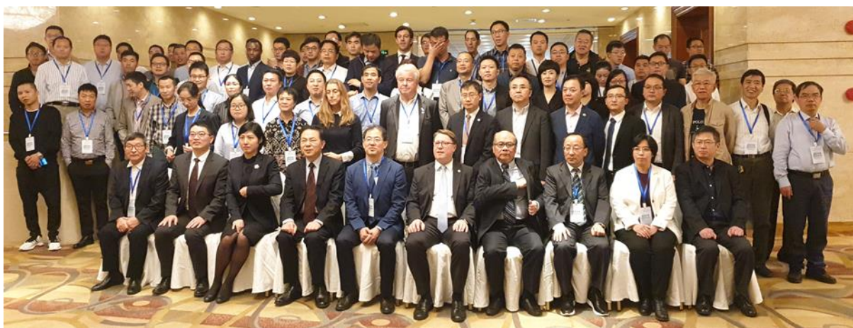
งานสัมมนาวิชาการ The 3 rd International Symposium on Offshore Aquaculture 2019

เมื่อวันที่ 18 ตุลาคม 2562 ฝ่ายเกษตรฯ ได้เข้าร่วมงานสัมมนาวิชาการเรื่อง "การพัฒนาการเพาะเลี้ยงสัตว์ทะเลนอกชายฝั่งอย่างยั่งยืน (sustainable offshore aquaculture)" เพื่อแลกเปลี่ยนข้อมูลหรือความรู้เกี่ยวกับการพัฒนาเทคโนโลยีการเพาะเลี้ยงสัตว์ทะเลระหว่างประเทศ เนื่องจากมีการคาดการณ์ว่าในปี 2030 ปริมาณสัตว์น้ำที่จับจากธรรมชาติที่แนวโน้มลดลงอย่างมาก ดังนั้น การเพาะเลี้ยงสัตว์น้ำจึงมีบทบาทสำคัญในการผลิตอาหารที่เป็นหนึ่งในปัจจัยสี่ของมนุษย์ และการเพาะเลี้ยงสัตว์น้ำทางทะเลเชิงอนุรักษ์สิ่งแวดล้อมจะมีบทบาทสำคัญต่อการเพาะเลี้ยงสัตว์น้ำในอนาคต เนื่องจากรูปแบบการเพาะเลี้ยงสัตว์แบบดั้งเดิมก่อให้เกิดมลภาวะทางธรรมชาติ