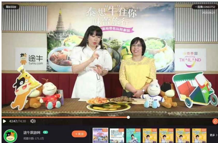
กงสุลฝ่ายเกษตรฯ สร้างความเชื่อมั่นในการบริโภคกุ้งไทย และสาธิตวิธีปรุงอาหารโดยใช้กุ้งไทย

เมื่อวันที่ 23 มิถุนายน 2563 ฝ่ายเกษตรฯ และการท่องเที่ยวแห่งประเทศไทยสำนักงานเชียงใหม่ ร่วมมือกับบริษัท Tuniu ที่เป็นบริษัทท่องเที่ยวออนไลน์ขนาดใหญ่ของจีน จัดกิจกรรม Live-streaming ประชาสัมพันธ์ภาพลักษณ์การท่องเที่ยวไทยและกุ้งไทย ผ่านช่องทาง Weibo ของบริษัท