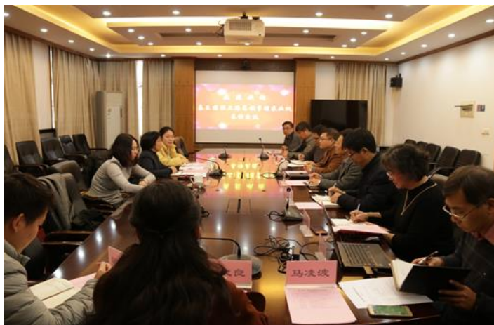
ฝ่ายเกษตรฯ ประชุมหารือกับสถาบันวิจัยวิทยาศาสตร์ประมงทะเลตะวันออกจีนเกี่ยวกับความร่วมมือภาคประมงจีน-ไทย

ทั้งนี้ สถาบัน ECSFRI มีการดำเนินการสร้าง Floating habitat และสร้างปะการังเทียมบนปากแม่น้ำแยงซีเกียง การพัฒนาเทคโนโลยีอุปกรณ์จับปลา และการวิจัยด้านความแข็งแรงของอวนจับสัตว์น้ำ เพื่อการแก้ไขปัญหาทรัพยากรธรรมชาติจีนอย่างยั่งยืน