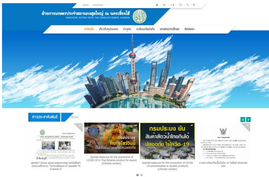
เว็บไซต์ฝ่ายเกษตร ประจำสถานกงสุลใหญ่ ณ นครเซี่ยงไฮ้

ฝ่ายเกษตรฯ ได้ติดตามข่าวสาร สถานการณ์ แนวโน้มและการเคลื่อนไหวด้านการเกษตรของจีน รวมทั้งกฎระเบียบ ข้อกำหนด มาตรการสินค้าเกษตรต่างๆ อีกทั้งได้สำรวจ เก็บข้อมูลราคาผลไม้ตลาดค้าส่ง ตลาดค้าปลีกและตลาดออนไลน์ ราคาสินค้าประมงในตลาดสินค้าประมงเซี่ยงไฮ้ ราคาขงพาราในตลาดเซี่ยงไฮ้ล่วงหน้า และสถิติการนำเข้าสินค้าเกษตรไทยในจีน ตลอดจนนำเสนอกิจกรรมต่างๆ ของฝ่ายเกษตร ซึ่งได้ประมวผล และเผยแพร่ประชาสัมพันธ์แก่ผู้ที่สนใจผ่านเว็บไซต์ของฝ่ายเกษตรฯ ที่ https://www.opsmoac.go.th/shanghai-home และ ผ่านช่องทางออนไลน์ Facebook ที่มีชื่อว่า Thailand Office of Agriculture Affairs, Shanghai