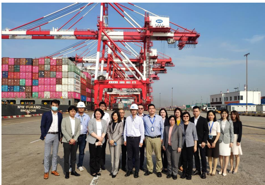
ทีมประเทศไทยประชุมและดูงาน ณ ท่าเรือเซี่ยงไฮ้ (ท่าเรือไวเกาเฉียว)

บริษัท Shanghai International Port (Group) CO.,Ltd และ Zhendong Container Terminal Branch หรือ SIPG Zhendong Branch เป็นหนึ่งในบริษัทที่ดำเนินกิจการโลจิสติกส์ของท่าเรือไวเกาเฉียว โดยรับผิดชอบพื้นที่ท่าเรือเฟส 2 และเฟส 3 (จากทั้งหมด 8 เฟส) ซึ่งบริษัทฯ ได้รองรับเรือสินค้าจากเส้นทางทวีปอเมริกาและยุโรป รองลงมา ได้แก่ เส้นทางจากญี่ปุ่น เกาหลีใต้ และกลุ่มประเทศอาเซียน ทั้งนี้ ในช่วงการแพร่ระบาดของไวรัสโควิด-19 เส้นทางทางการขนส่งสินค้าทวีปอเมริกาและทวีปยุโรปได้รับผลกระทบมากที่สุด และประสบปัญหาขาดแคลนพื้นที่รองรับคอนเทนเนอร์ห้องเย็นไม่เพียงพอ อย่างไรก็ตาม สถานการณ์ปัจจุบันการขนส่งสินค้าผ่านท่าเรือกลับเข้าสู่ภาวะปกติ นอกจากนี้ ท่าเรือไวเกาเฉียวยังมีศักยภาพเพียงพอที่จะรองรับการขนส่งผลไม้ หากมีความต้องการใช้บริการดังกล่าว ท่าเรือฯ สามารถปรับปรุงสิ่งอำนวยความสะดวกต่าง ให้เหมาะสมกับการรองรับสินค้าผลไม้ที่จะเพิ่มขึ้น นับว่าเป็นอีกทางเลือกหนึ่งในการขนส่งผลไม้ไทยนอกจากเส้นทางทางบกที่ใช้อยู่ในปัจจุบัน