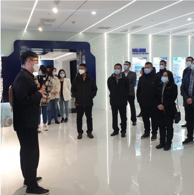
ทีมประเทศไทย ณ นครเซี่ยงไฮ้และหอการค้าไทยในจีนเข้าเยี่ยมชมศูนย์แลกเปลี่ยน

เมื่อวันที่ 27 พฤศจิกายน 2563 หอการค้าไทยในจีนได้เชิญทีมประเทศไทย ณ นครเซี่ยงไฮ้ เข้าพบหารือกับศูนย์แลกเปลี่ยนข้อมูลเซี่ยงไฮ้ (Shanghai Data Exchange Corp) พร้อมเยี่ยมชมกิจกรรม โดยศูนย์แลกเปลี่ยนข้อมูลเซี่ยงไฮ้ เป็นหน่วยงานรับผิดชอบด้านการพัฒนาและบริหารจัดการข้อมูล Big Data ของนครเซี่ยงไฮ้ ซึ่งมีโครงการผนวกข้อมูลภาครัฐและเอกชน ชื่อ “Five in One” มีหน่วยงาน 5 ด้านสำคัญของนครเซี่ยงไฮ้ให้การสนับสนุน ได้แก่ หน่วยงานด้านการค้า นวัตกรรม กองทุนอุตสาหกรรม พันธมิตรการพัฒนาและศูนย์วิจัย เพื่อส่งเสริมการเชื่อมโยงฐานข้อมูลและการทำงานระหว่างภาครัฐและภาคเอกชน