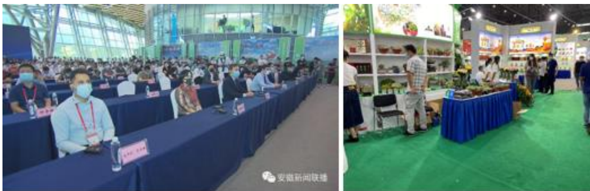
กงสุล (ฝ่ายเกษตรฯ) เข้าร่วมเป็นแขกผู้ทรงเกียรติและเยี่ยมชมงานแสดงสินค้าเกษตรนานาชาติขนาดใหญ่ของมณฑลอานฮุย

มณฑลที่มีทรัพยากรนิเวศวิทยาที่ดี มีวัฒนธรรมและนวัตกรรมชั้นนำของจีน รวมถึงยังเป็นมณฑลที่อยู่ในแผนการพัฒนาประเทศจีน 2 แผน คือ แผนการพัฒนาแบบบูรณาการสามเหลี่ยมปากแม่น้ำแยงซีเกียง และแผนการพัฒนาภาคกลางของจีน นอกจากนี้ มณฑลอานฮุยยังเป็นพื้นที่หลักในด้านเกษตรกรรม มีผลผลิตภาคเกษตรประมาณ 40 ล้านตันต่อปี มูลค่าการแปรรูปสินค้าเกษตรมากกว่า 1 ล้านล้านหยวน รายได้ภาคเกษตรเพื่อการท่องเที่ยว 78,800 ล้านหยวน ยอดขายสินค้าเกษตรผ่านช่องทางออนไลน์ 60,000 ล้านหยวน ปัจจุบัน มณฑลอานฮุยส่งเสริมการพัฒนาพื้นที่ให้เป็นพื้นที่นวัตกรรม/เทคโนโลยีสมัยใหม่ และอุตสาหกรรมแบบใหม่ ตามนโยบายเส้นทางสายใหม่ 1 แถบ 1 เส้นทาง