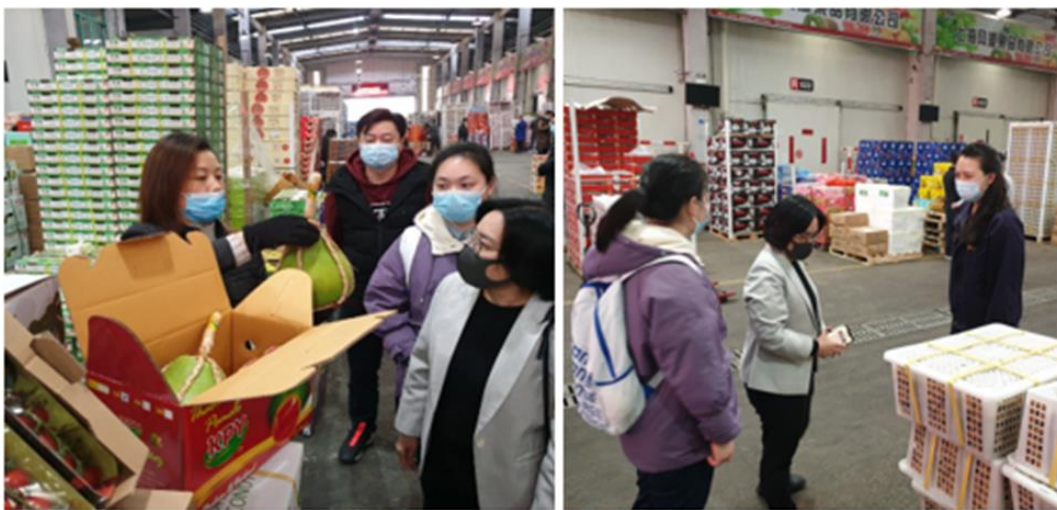
กงสุล (ฝ่ายเกษตรฯ) เยี่ยมชมการบริหารงานของตลาดซีเจียว และพบปะหารือกับผู้ประกอบการนำเข้าผลไม้ในตลาด

จากการเยี่ยมชมตลาดและพบปะผู้ประกอบการจำหน่ายไม้ในตลาดซีเจียว พบว่า ในตลาดซีเจียวมีผู้ประกอบการจำหน่ายผลไม้นำเข้าจากต่างประเทศประมาณ 100 ราย ซึ่งปริมาณการค้าส่งผลไม้ต่างประเทศ 600 ตันต่อวัน ราคาจำหน่ายผลไม้ไทยในตลาดซีเจียวในช่วงนี้ค่อนข้างสูง ได้แก่ ราคาค้าส่งส้มโอสยาม (เนื้อแดง) 150 หยวนต่อลูก มังคุด 40 หยวนต่อ 500 กรัม ทูเรียนหมอนทอง 45 หยวนต่อ 500 กรัม มะพร้าวอ่อนพร้อมรับประทาน 20 หยวนต่อลูก และมะพร้าวเผา 9 หยวนต่อลูก ซึ่งผู้ประกอบการจำหน่ายผลไม้ไทยแจ้งว่า ในช่วงนี้ทุเรียนไทยราคาสูงมากและรสชาติยังไม่ค่อยคงที่