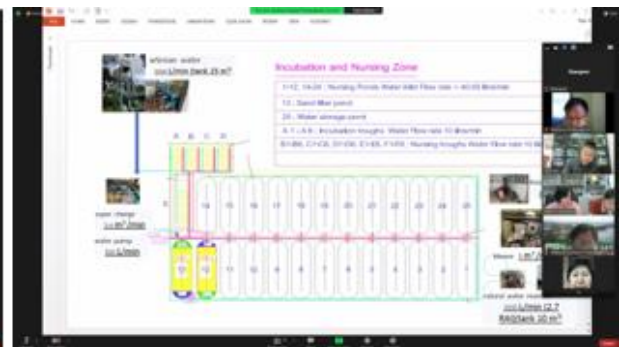
ประชุมติดตามความคืบหน้าโครงการการปรับปรุงระบบเพาะเลี้ยงสัตว์น้ำหมุนเวียนแบบครบวงจร ณ เชียงใหม่ ระหว่างฝ่ายเกษตรฯ กรมประมงและ สถาบันวิจัยฯ

ศูนย์วิจัยและพัฒนาการเพาะเลี้ยงสัตว์น้ำจืดเชียงใหม่ประสงค์จะดำเนินโครงการให้แล้วเสร็จภายในไตรมาสที่ 1 ของปี 2565 เพื่อการแก้ไขปัญหาการเพาะเลี้ยงในช่วงฤดูแล้งของประเทศไทย นอกจากนี้ เชียงใหม่จะเป็นศูนย์การเรียนรู้แห่งแรกที่เกษตรกร หน่วยงานภาครัฐและผู้ที่สนใจสามารถเข้ามาศึกษาระบบเพาะเลี้ยงสัตว์น้ำหมุนเวียนแบบครบวงจรแห่งแรกประเทศไทย