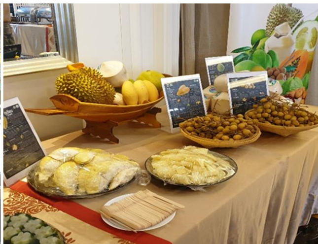
กงสุล (ฝ่ายเกษตรฯ) แนะนำผลไม้ไทยแต่ละชนิด คุณประโยชน์และจุดเด่นของผลไม้ พร้อมทั้ง จัดเตรียมผลไม้ไทยให้กับเด็กนักเรียนและผู้ปกครองโรงเรียน YK PAO School