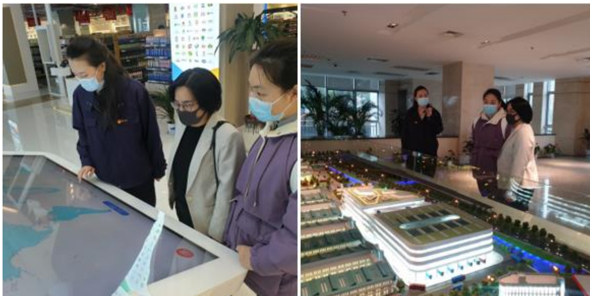
กงสุล (ฝ่ายเกษตรฯ) เข้าพบหารือกับรองผู้จัดการตลาดซีเจียว นครเซี่ยงไฮ้

เมื่อวันที่ 22 มีนาคม 2564 ฝ่ายเกษตร ประจำสถานกงสุลใหญ่ ณ นครเซี่ยงไฮ้พบปะหารือกับรองผู้จัดการตลาดซีเจียว นครเซี่ยงไฮ้ และผู้ประกอบการในตลาด เพื่อติดตามสถานการณ์การค้าผลไม้ไทยในตลาดซีเจียว โดยตลาดซีเจียวเป็นตลาดค้าส่งสินค้าเกษตรที่สำคัญของนครเซี่ยงไฮ้ ซึ่งได้ใช้รูปแบบโครงสร้างและการบริหารตามแบบตลาด Rungis International Market ของประเทศฝรั่งเศส มีการจำหน่ายผัก ผลไม้ และเนื้อสุกร รวมทั้งสนับสนุนให้ผลผลิตการเกษตรจากพื้นที่ชนบทมาจำหน่ายในตลาด นอกจากนี้ ยังมีการจำหน่ายผลไม้นำเข้าและผลไม้ไทยในตลาดด้วย