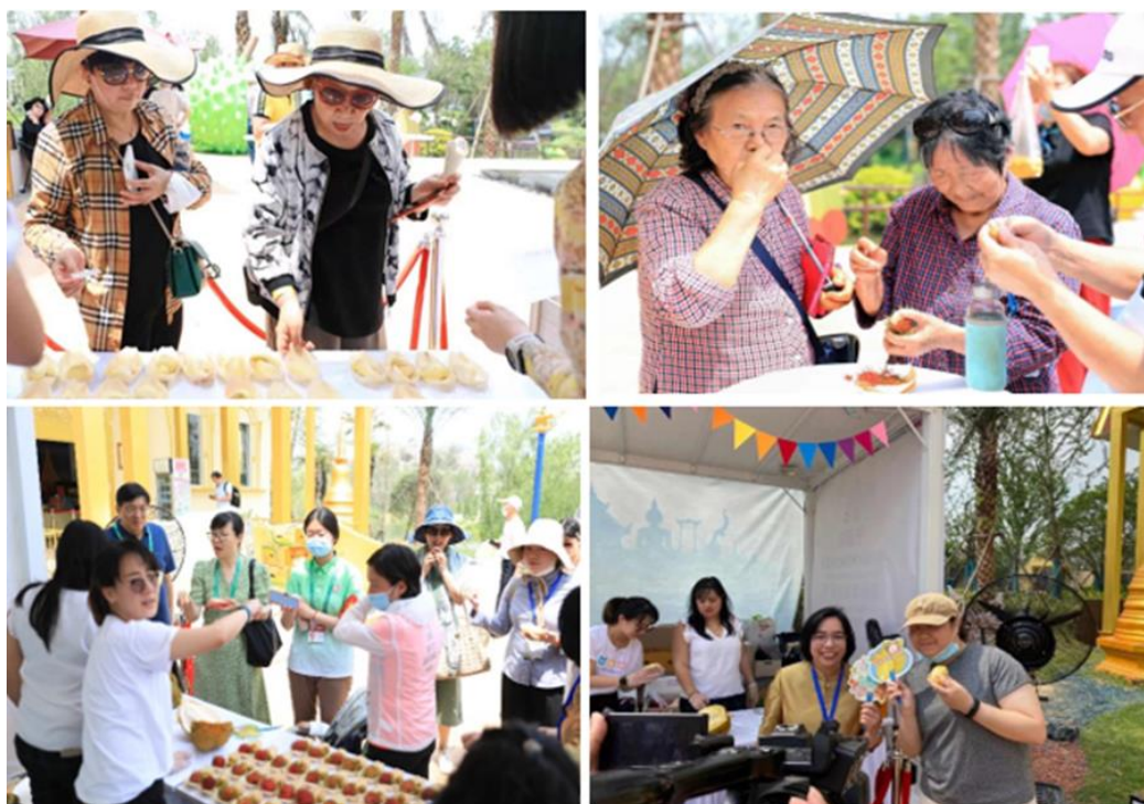
กิจกรรมแจกชิมผลไม้ไทย ได้แก่ ทูเรียนหมอนทอง ลำไย และเงาะ พร้อมทั้งการทำแบบสอบถามเกี่ยวกับผลไม้ไทย

นิทรรศการประชาสัมพันธ์ผลไม้และกล้วยไม้ไทย (Thai Fruit and Orchid Festival) เพื่อเป็นการประชาสัมพันธ์ผลไม้ไทยให้เป็นที่รู้จักในเมืองหยางโจว โดยนำผลไม้สดจากประเทศไทย 8 ชนิด ได้แก่ ทูเรียน มังคุด ลำไย เงาะ น้อยหน่า ชมพู มะพร้าวเผา และมะม่วง นอกจากนี้ ยังได้จัดนิทรรศการแบบสามมิติ โดยมีบอลูนยักษ์เป็นทูเรียนและมังคุดขนาดสูง 3 เมตร และบอลูนขนาดกลางของผลไม้ 5 ชนิด ได้แก่ มะพร้าว มะม่วง สับปะรด ชมพู และส้มโอ รวมทั้งบอร์ดรูปผลไม้ไทย 9 บอร์ด และบอร์ดนิทรรศการแสดงข้อมูลให้ความรู้เกี่ยวกับผลไม้ไทย 22 ชนิดที่จีนอนุญาตให้ไทยนำเข้า อีกทั้งยังมีการตกแต่งซุ้มกล้วยไม้ไทยขนาดใหญ่ โดยใช้กล้วยไม้นำเข้าจากประเทศไทยหลากหลายสี ซึ่งเป็นที่ประทับใจของนักท่องเที่ยวเป็นอย่างมาก