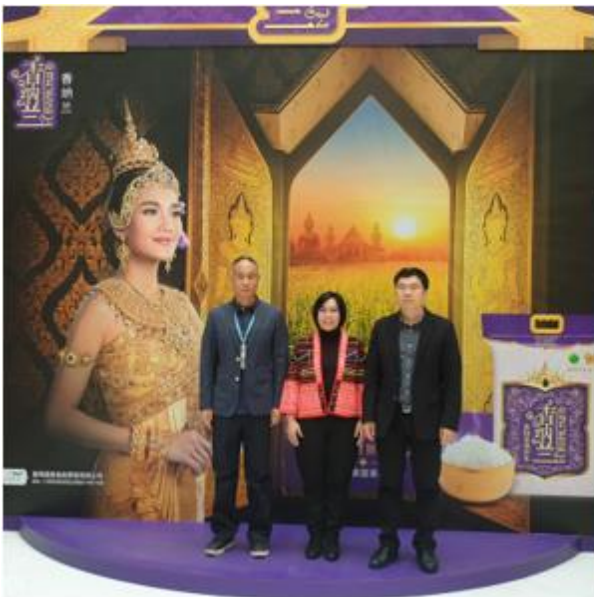
กงสุล (ฝ่ายเกษตรฯ) เข้าร่วมกิจกรรมประชาสัมพันธ์เปิดตัวสินค้าข้าวหอมมะลิไทยและเยี่ยมชมบูธต่างๆ

เมื่อวันที่ 7 ธันวาคม 2563 ฝ่ายเกษตรฯ เข้าร่วมกิจกรรมประชาสัมพันธ์เปิดตัวสินค้าข้าวหอมมะลิไทย ซึ่งจัดโดยบริษัท Yihai Kerry group และร่วมกิจกรรมถ่ายทอดสด live streaming ประชาสัมพันธ์ข้าวหอมมะลิไทยรอบการเก็บเกี่ยวใหม่ ผ่านแพลตฟอร์มออนไลน์จินตง (JD.com) เพื่อสร้างความเชื่อมั่นให้กับผู้บริโภคจีน