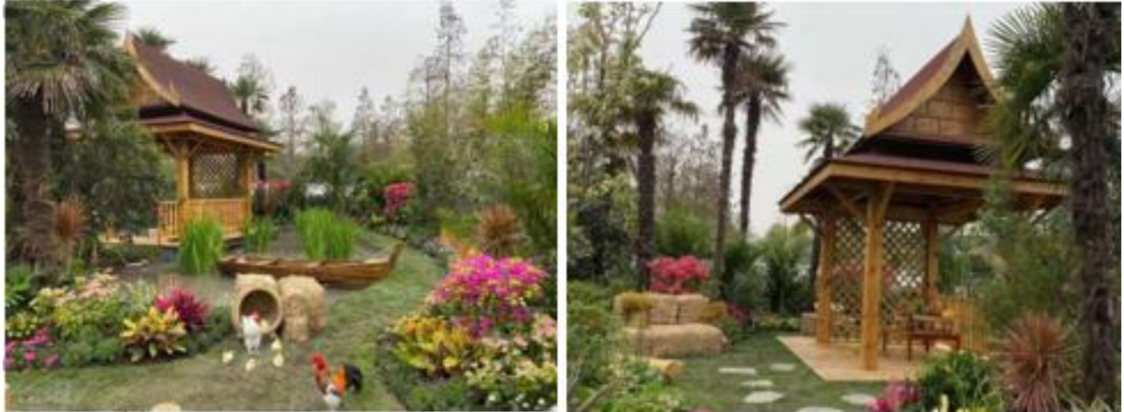
พื้นที่สวนไทยในแนวคิด (Theme) “Simple Touch of Thailand” ณ สวนพฤกษศาสตร์เชียงใหม่

ฝ่ายเกษตร ประจำสถานกงสุลใหญ่ ณ นครเชียงใหม่ จัดนิทรรศการประชาสัมพันธ์ภาพลักษณ์สินค้าเกษตรไทย ณ สวนพฤกษศาสตร์เชียงใหม่ (Shanghai Botanical Garden) ซึ่งสวนพฤกษศาสตร์เชียงใหม่อยู่ภายใต้ความรับผิดชอบของรัฐบาลเชียงใหม่ พื้นที่ทั้งหมด 532 ไร่ ผู้เข้าชมปีละประมาณ 5-7 ล้านคน โดยในปลายเดือนมีนาคม - พฤษภาคมของทุกปี จะมีการจัดงาน Shanghai International Flower Show ซึ่งเป็นงานแสดงพรรณไม้และสวนนานาชาติ ที่ผู้เข้าร่วมจัดสวนจากมณฑลต่างๆ ของจีนและต่างประเทศ ซึ่งฝ่ายเกษตรฯ ได้เข้าร่วมจัดสวนไทยในงาน Shanghai International Flower Show ตั้งแต่ปี พ.ศ. 2560