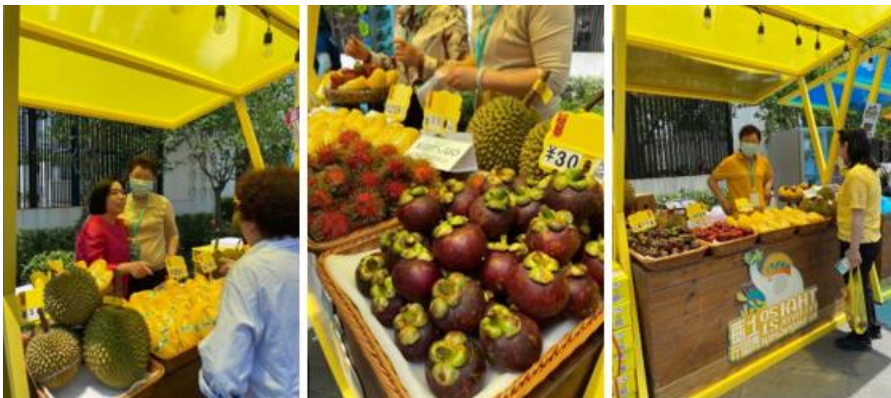
ผู้ประกอบการจีนที่นำเข้าผลไม้ไทยมาร่วมจัดแสดงและจำหน่ายผลไม้ไทยภายในงาน โดยผลไม้ต่างก็ได้รับผลตอบรับเป็นอย่างดี ปริมาณการจำหน่ายผลไม้ในงานนี้ประมาณ 3,000 กิโลกรัม

นอกจากนี้ ยังได้เชิญผู้ประกอบการจีนที่นำเข้าผลไม้ไทยมาร่วมจัดแสดงและจำหน่ายผลไม้ไทยภายในงาน ได้แก่ ทุเรียน 3 สายพันธุ์ (หมอนทอง ก้านยาว พวงมณี) มะม่วง มังคุด เงาะ ชมพู โดยทุเรียนก้านยาวและพวงมณีถูกจำหน่ายจนหมดภายในระยะเวลา 3-4 ชั่วโมง ส่วนผลไม้อื่นๆ ต่างก็ได้รับผลตอบรับเป็นอย่างดี ปริมาณการจำหน่ายผลไม้ในงานนี้ประมาณ 3,000 กิโลกรัม เมื่อวันที่ 21-23 พฤษภาคม 2564 สถานกงสุลใหญ่ ณ นครเชียงใหม่ และทีมประเทศไทยจัดงานเทศกาลไทย (Thai Festival) ครั้งที่ 3 ณ สถานกงสุลใหญ่ ณ นครเชียงใหม่