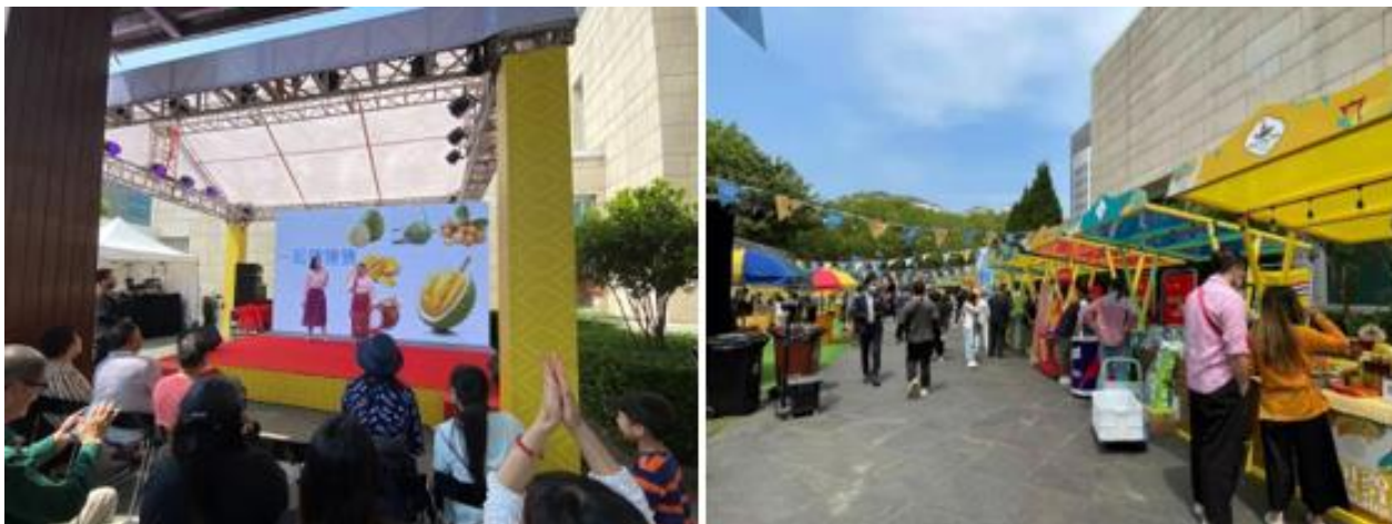
ฝ่ายเกษตรฯ จัดกิจกรรมเล่นเกมผลไม้แสนสนุก มเพื่อประชาสัมพันธ์ผลไม้ไทยที่สามารถนำเข้าจีนได้ 22 ชนิด

ภายในงานฯ ฝ่ายเกษตรฯ เชียงไฮ้ ได้จัดกิจกรรมเพื่อประชาสัมพันธ์ผลไม้ไทย โดยจัดให้มีการเล่นเกมผลไม้แสนสนุกที่สอดแทรกความรู้เกี่ยวกับผลไม้ไทยที่สามารถนำเข้าจีนได้ 22 ชนิด พร้อมทั้งมีการแจกรางวัลให้กับผู้เข้าร่วมกิจกรรม วันละ 5 รอบ โดยตลอดระยะเวลา 3 วัน มีผู้สนใจร่วมเล่นเกมกว่า 200 คน