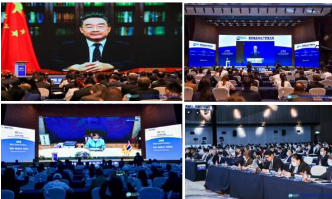
สมเด็จพระกนิษฐาธิราชเจ้า กรมสมเด็จพระเทพรัตนราชสุดาฯ สยามบรมราชกุมารี ทรงร่วมการประชุมระดับโลกด้านการเพาะเลี้ยงสัตว์น้ำผ่านระบบออนไลน์การประชุม Global Conference on Aquaculture Millennium+20 (GCA+20)

เมื่อวันที่ 23 กันยายน 2564 ฝ่ายเกษตรกรฯ เข้าร่วมการประชุม Global Conference on Aquaculture Millennium+20 (GCA+20) ที่ นครเซี่ยงไฮ้ โดยกระทรวงเกษตรและกิจการชนบทจีน องค์การอาหารและการเกษตรแห่งสหประชาชาติ (FAO) และองค์การชำนัญพิเศษเพาะเลี้ยงสัตว์น้ำแห่งเอเชียและแปซิฟิก(NACA) ร่วมกันเป็นเจ้าภาพขึ้น เมื่อวันที่ 23 - 24 กันยายน 2564 ณ นครเซี่ยงไฮ้ โดยเมื่อวันที่ 24 กันยายน 2564 สมเด็จพระกนิษฐาธิราชเจ้า กรมสมเด็จพระเทพรัตนราชสุดาฯ สยามบรมราชกุมารี ทรงร่วมการประชุมระดับโลกด้านการเพาะเลี้ยงสัตว์น้ำ ผ่านระบบออนไลน์ โดยได้พระราชทานพระราชดำริเกี่ยวกับเป้าหมายการพัฒนาที่ยั่งยืน เป้าหมายที่สอง ขจัดความหิวโหยภายใต้โครงการพระราชดำริ ในช่วงการรับรองปฏิญญาเซี่ยงไฮ้ (Shanghai Declaration) ตามคำกราบบังคมทูลเชิญของ Dr. Matthias Halwart, Team Leader of GCA, FAO