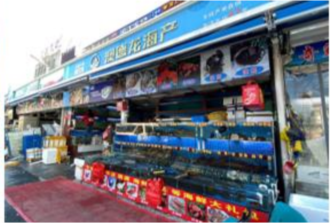
ร้านค้าที่จำหน่ายสินค้าประมงในตลาดสินค้าประมงเจียงหยางนครเซี่ยงไฮ้