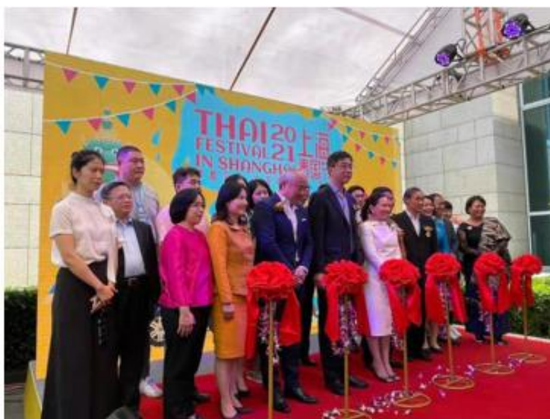
พิธีเปิดงานประชาสัมพันธ์ผลไม้ในงานเทศกาลไทย (Thai Festival)