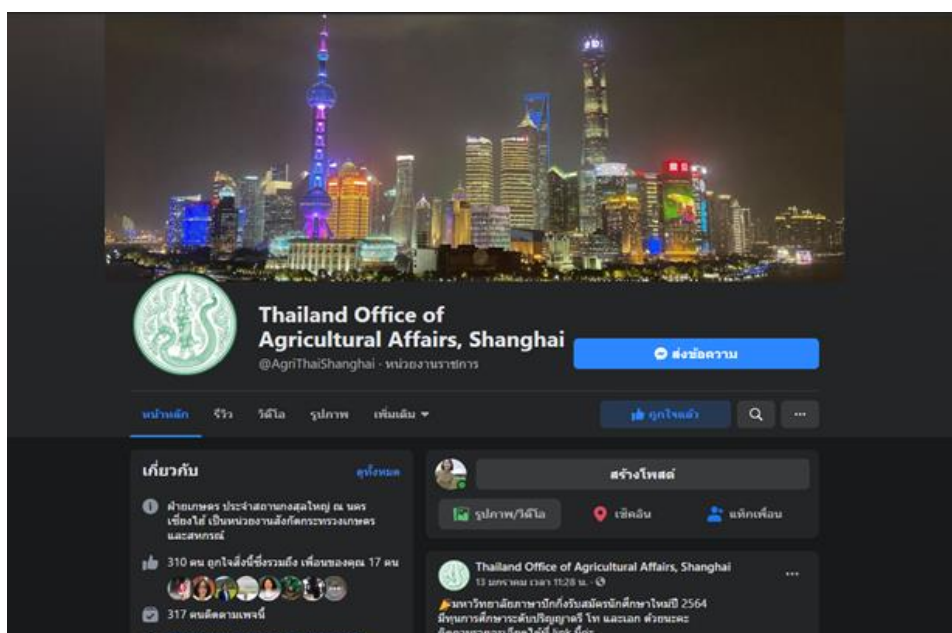
ช่องทางประชาสัมพันธ์ฝ่ายเกษตร ประจำสถานกงสุลใหญ่ ณ นครเซี่ยงไฮ้