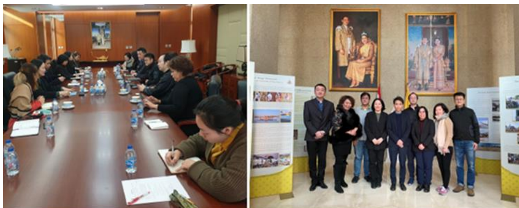
ทีมประเทศไทย ณ นครเซี่ยงไฮ้ และหอการค้าไทยในจีน ร่วมหารือกับผู้นำเข้าสินค้าประมงไทย เกี่ยวกับสถานการณ์การระบาดของโควิด 19 ณ ตลาดกลางกุ้ง จังหวัดสมุทรสาคร

แม้ว่าในวันที่ 20 ธันวาคม 2563 สื่อมวลชนประเทศจีนเผยแพร่ข่าวสถานการณ์การระบาดของโควิด 19 ระลอกใหม่ ณ ตลาดกลางกุ้ง จังหวัดสมุทรสาคร ซึ่งเป็นตลาดศูนย์กระจายสินค้าอาหารทะเลและแหล่งอุตสาหกรรมประมงแปรรูปหลักของไทย สถานการณ์โควิดในประเทศไทยไม่รุนแรงจนถึงขั้นมีคำสั่งยกเลิกคำสั่งซื้อสินค้ากุ้ง แต่ผู้นำเข้ากุ้งไทยเห็นว่าโรงงานแปรรูปควรดำเนินการป้องกันเชื้อโควิดในสินค้าประมงส่งออกตามมาตรการที่กำหนดอย่างเคร่งครัด