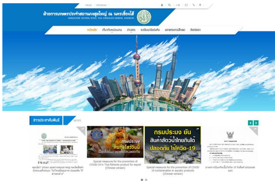
เว็บไซต์ฝ่ายเกษตร ประจำสถานกงสุลใหญ่ ณ นครเซี่ยงไฮ้

ฝ่ายเกษตรฯ ได้ติดตามข่าวสาร สถานการณ์ แนวโน้มและการเคลื่อนไหวด้านการเกษตรของจีน รวมทั้งกฎระเบียบ ข้อกำหนด มาตรการสินค้าเกษตรต่างๆ อีกทั้งได้สำรวจ เก็บข้อมูลราคาผลไม้ตลาดค้าส่ง ตลาดค้าปลีก และตลาดออนไลน์ ราคาสินค้าประมงในตลาดสินค้าประมงเซี่ยงไฮ้ ราคาขงพาราในตลาดเซี่ยงไฮ้ล่วงหน้า และสถิติการนำเข้าสินค้าเกษตรไทยในจีน ตลอดจนนำเสนอกิจกรรมต่างๆ ของฝ่ายเกษตร ซึ่งได้ประมวลผลและเผยแพร่ประชาสัมพันธ์แก่ผู้ที่สนใจผ่านเว็บไซต์ของฝ่ายเกษตรฯ ที่ https://www.opsmoac.go.th/shanghai-home และผ่านช่องทางออนไลน์ Facebook ที่มีชื่อว่า Thailand Office of Agriculture Affairs, Shanghai