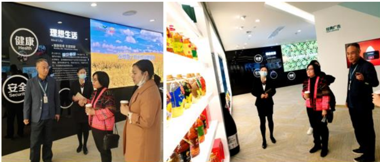
กงสุล ( ฝ่ายเกษตรฯ ) พบปะหารือผู้บริหาร Yihai Kerry group และเข้าเยี่ยมชมนิทรรศการของบริษัทฯ

Yihai Kerry group เป็นบริษัทในเครือของบริษัท Wilmar International Limited ก่อตั้งขึ้นในปี 2005 (พ.ศ. 2548) ในประเทศจีน มีการผลิตและการนำเข้าสินค้าเกษตรและอาหาร เช่น น้ำมันพืช ธัญพืช เครื่องปรุงอาหาร น้ำผึ้ง และข้าวหอมมะลิไทย โดยเฉพาะน้ำมันพืชเป็นสินค้าหลักยี่ห้อ “ปลามังกรทอง” เป็นที่รู้จักและนิยมของผู้บริโภคจีน สำหรับข้าวไทยมีการนำเข้าจากจังหวัดเชียงรายและอุบลราชธานี โดยในจังหวัดอุบลราชธานีมีพื้นที่นำข้าวหอมมะลิเพื่อส่งเป็นผลิตภัณฑ์ของบริษัท