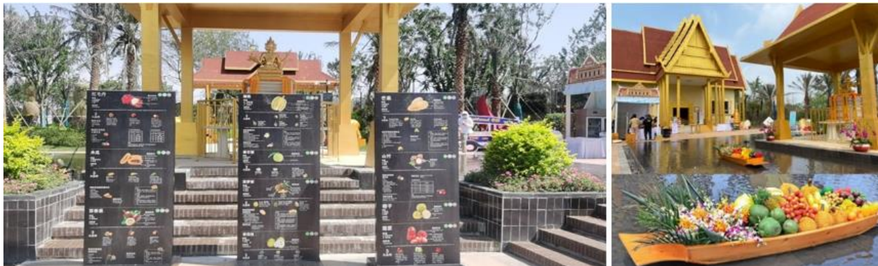
นิทรรศการประชาสัมพันธ์ผลไม้และกล้วยไม้ไทย (Thai Fruit and Orchid Festival)

กระทรวงเกษตรและสหกรณ์มอบหมายให้ฝ่ายเกษตร ประจำสถานกงสุลใหญ่ ณ นครเซี่ยงไฮ้ เป็นผู้แทนจัดกิจกรรมส่งเสริมประชาสัมพันธ์สินค้าเกษตรไทย ณ สวนไทย ในงานพืชสวนโลก เมืองหยางโจว มณฑลเจียงซู สาธารณรัฐประชาชนจีน ระหว่างวันที่ 29 พฤษภาคม - 4 มิถุนายน 2564 โดยได้รับการสนับสนุนงบประมาณจากกรมส่งเสริมการเกษตร