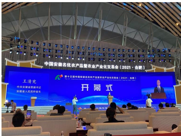
พิธีเปิดงาน The 13 th China Anhui Famous High Quality Agricultural Products & Agricultural Industrialization Trade Fair

เมื่อวันที่ 16-17 กันยายน 2564 ฝ่ายเกษตรฯ ได้เข้าเยี่ยมชมการระหวะผู้บริหารมณฑลอานฮุย นางเฉิง ลีหัว รองเลขาธิการคณะกรรมการพรรคคอมมิวนิสต์จีนประจำมณฑลอานฮุย/ผู้บริหารระดับสูงของมณฑลอานฮุย ในวันที่ 16 กันยายน 2564 และการเข้าเยี่ยมชมการระหวะรองผู้ว่าราชการเมืองเหอเฟย มณฑลอานฮุย ในวันที่ 17 กันยายน 2564 ในโอกาสที่เดินทางไปร่วมงาน The 13 th China Anhui Famous High Quality Agricultural Products & Agricultural Industrialization Trade Fair ณ เมืองเหอเฟย มณฑลอานฮุย สาธารณรัฐประชาชนจีน