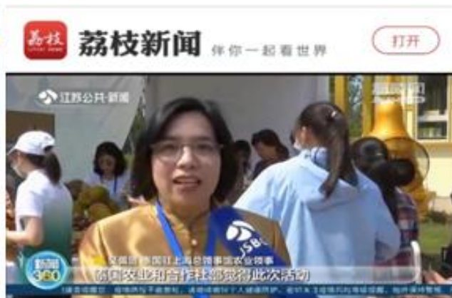
กงสุล (ฝ่ายเกษตรฯ) ให้สัมภาษณ์กับนักข่าวท้องถิ่นมณฑลเจียงซูและเมืองหยางโจว โดยเชิญชวนให้ชาวจีนในพื้นที่และบริเวณใกล้เคียงมาเยี่ยมชมงานดังกล่าว