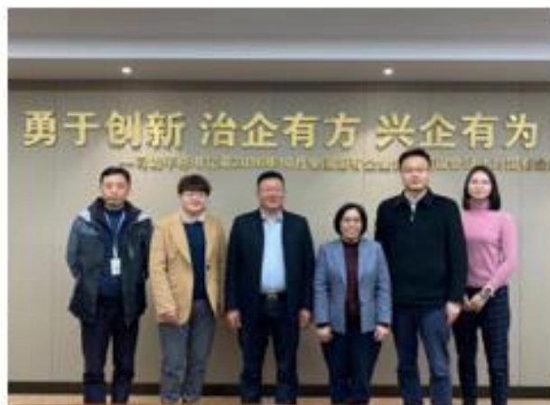
กงสุล (ฝ่ายเกษตรฯ) เข้าพบหารือกับผู้บริหารระดับสูงและผู้ประกอบการนำเข้าผลไม้ของตลาดซังหนงพี (Shang Nong Pi Market , SAP)