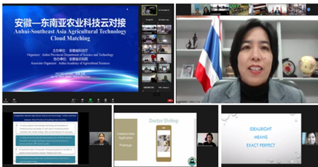
กงสุล (ฝ่ายเกษตรฯ) เข้าร่วมเป็นแขกผู้ทรงคุณวุฒิกล่าวเปิดงานการประชุมจับคู่ความร่วมมือออนไลน์ และผู้แทนไทยเข้าร่วมเสนอข้อมูลงานวิจัย

เมื่อวันที่ 15 มกราคม 2564 ศูนย์แลกเปลี่ยนด้านวิทยาศาสตร์และเทคโนโลยีมณฑลฮานฮุยจัดกิจกรรมการประชุมและจับคู่ความร่วมมือออนไลน์ด้านเทคโนโลยีการเกษตร (cloud matching) เป็นครั้งแรก โดยมีรูปแบบกิจกรรมเป็น online road show หรือการนำเสนอโครงการ/กิจกรรมด้านเทคโนโลยีการเกษตรและ web conference ผ่านระบบ Zoom ผู้เข้าร่วมประชุมเป็นผู้แทนจากหน่วยงานภาครัฐและเอกชนจาก 7 ประเทศ คือ จีน เวียดนาม ฟิลิปปินส์ ปากีสถาน บังคลาเทศ รัสเซีย และไทย (กรมประมง กรมวิชาการเกษตร กรมส่งเสริมการเกษตร และกรมปศุสัตว์)