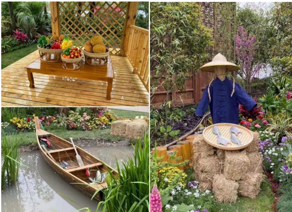
พื้นที่สวนไทยในแนวคิด (Theme) “Simple Touch of Thailand” ณ สวนพฤกษศาสตร์เชียงใหม่

ในปีนี้ ฝ่ายเกษตรฯ ได้จัดนิทรรศการประชาสัมพันธ์ภาพลักษณ์สินค้าเกษตรไทยในพื้นที่สวนไทยในแนวคิด (Theme) “Simple Touch of Thailand” สื่อถึงวิถีชีวิตที่เรียบง่ายของเกษตรกรไทย ความอุดมสมบูรณ์ของผลผลิตทางการเกษตร ในน้ำมีปลา ในนามีข้าว ซึ่งผลิตผลทางการเกษตรของไทยส่งออกไปจำหน่ายทั่วโลก การประชาสัมพันธ์ผ่านพื้นที่สวนไทยสามารถเข้าถึงกลุ่มนักท่องเที่ยวชาวเชียงใหม่ได้เป็นอย่างดี ถือเป็น การสร้างภาพลักษณ์ของเกษตรกรไทยและสินค้าเกษตรของไทยได้อีกทางหนึ่ง