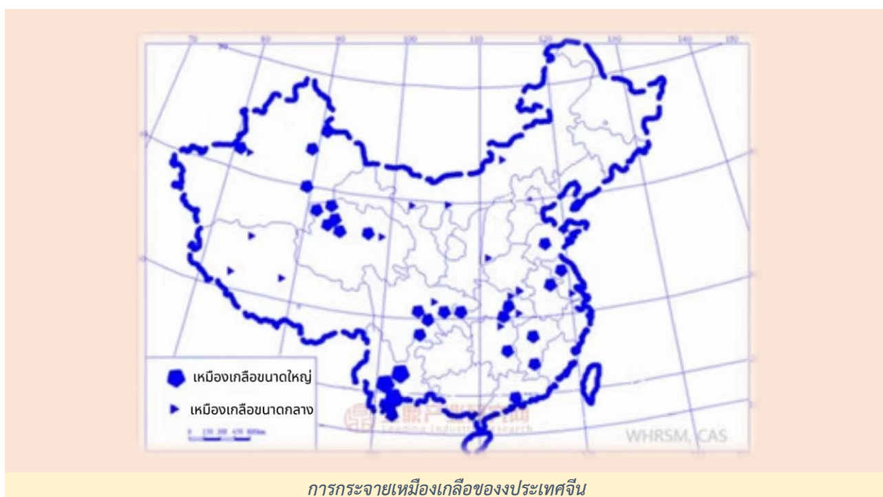
การกระจายเหมืองเกลือของประเทศจีน

ประเทศจีนมีการผลิตเกลือมานานมากกว่าพันปี ปัจจุบันบริษัทผลิตเกลือของจีนส่วนใหญ่เป็นรัฐวิสาหกิจและใช้มาตรการควบคุมการผลิตเกลือ ซึ่งผู้ผลิตและผู้ค้าส่งเกลือต้องได้รับการอนุญาตจากรัฐบาลเท่านั้น โดยแหล่งวัตถุดิบเกลือของจีน มี 3 แหล่ง คือ เกลือจากทะเล เกลือจากเหมือง และเกลือทะเลสาบ ซึ่งเกลือจากเหมืองมีสัดส่วนมากที่สุด ประมาณร้อยละ 70 - 75 พื้นที่การผลิตอยู่ในมณฑลเสฉวน หูเป่ย์ หูหนาน ส่านซี เจียงซู เหอหนาน และเจียงซี สำหรับเกลือทะเลมีสัดส่วนประมาณร้อยละ 15 - 20 พื้นที่การผลิตอยู่ในมณฑลที่ติดทะเล ได้แก่ มณฑลเหลียวหนิง เหอเป่ย์ เทียนจิน ซานตง และเจียงซู เกลือทะเลบางชนิดยังผลิตในมณฑลไห่หนานและกวางตุ้ง หรือเรียกทั่วไปว่าเกลือทะเลทางตอนใต้ มีผลผลิตค่อนข้างต่ำ ส่วนเกลือจากทะเลสาบมีสัดส่วนน้อยที่สุดประมาณร้อยละ 5 - 10 พื้นที่การผลิตอยู่ที่มณฑลชิงไห่ ชินเจียง มองโกเลียใน และกานซู โดยมณฑลชิงไห่เป็นพื้นที่ของทะเลสาบชิงไห่หรือทะเลสาบน้ำเค็มที่ใหญ่ที่สุดในประเทศจีน