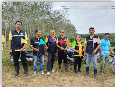
ภาพที่ ๑๒ ภาพตัวอย่างการปฏิบัติงานของอาสาสมัครเกษตรและสหกรณ์ระดับตำบล อำเภอนาหวี