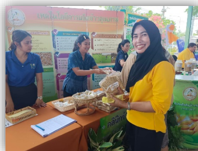
ภาพที่ ๑๑ ภาพตัวอย่างการปฏิบัติงานของอาสาสมัครเกษตรและสหกรณ์ระดับตำบล อำเภอกเทพา