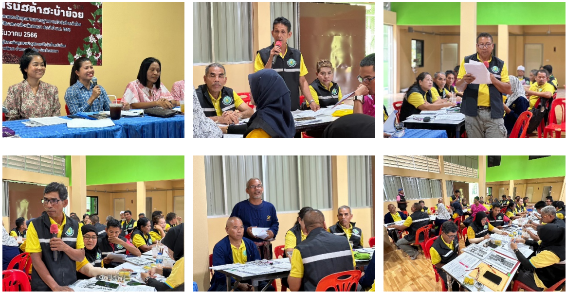
ภาพที่ ๕ การจัดประชุมอาสาสมัครเกษตรกรและสหกรณ์ระดับตำบล จังหวัดสงขลา ครั้งที่ ๑