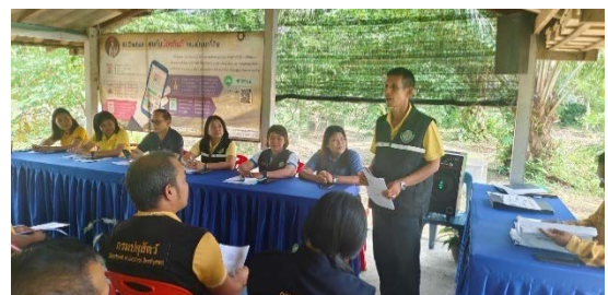
ภาพที่ ๘ การจัดการประชุมอาสาสมัครเกษตรและสหกรณ์ระดับตำบล จังหวัดสงขลา ครั้งที่ ๔