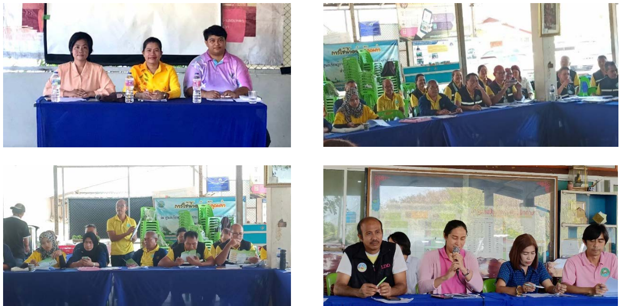
ภาพที่ ๖ การจัดประชุมอาสาสมัครเกษตรกรและสหกรณ์ระดับตำบล จังหวัดสงขลา ครั้งที่ ๒