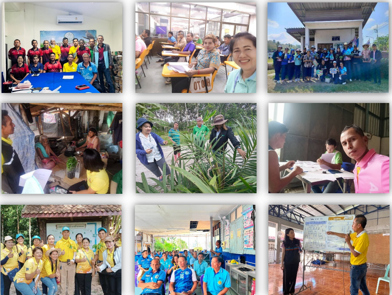
ภาพที่ ๑๐ ภาพตัวอย่างการปฏิบัติงานของอาสาสมัครเกษตรกรและสหกรณ์ระดับตำบล อำเภอจะนะ