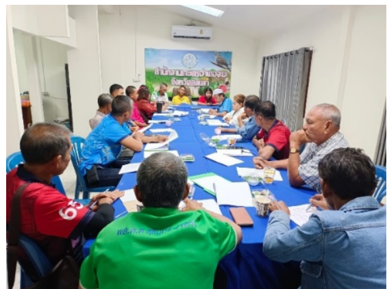
ภาพที่ ๔ การจัดประชุมอาสาสมัครเกษตรกรและสหกรณ์ระดับตำบล ระดับอำเภอ

๔.๑.๒ ระดับจังหวัด สำนักงานเกษตรและสหกรณ์จังหวัดสงขลาจัดประชุมอาสาสมัครเกษตรกรและสหกรณ์ระดับตำบล (๒ เดือนต่อ ๑ ครั้ง) โดยมีอาสาสมัครเกษตรกรและสหกรณ์ระดับตำบล ผู้แทนคณะกรรมการขับเคลื่อนงานด้านการเกษตรระดับจังหวัด (Single Command Province : SCP) และผู้แทนคณะทำงานขับเคลื่อนงานด้านการเกษตรระดับอำเภอเข้าร่วมประชุม เพื่อขับเคลื่อนงานการพัฒนาด้านการเกษตรในพื้นที่จังหวัดชายแดนภาคใต้ และมอบหมายภารกิจ พร้อมทั้งให้อาสาสมัครเกษตรกรและสหกรณ์ระดับตำบลรายงานผลการปฏิบัติงานให้ที่ประชุมทราบ โดยในปีงบประมาณ พ.ศ. ๒๕๖๗ จังหวัดสงขลา จัดการประชุมอาสาสมัครเกษตรกรและสหกรณ์ระดับตำบล จังหวัดสงขลา จำนวน ๕ ครั้ง ซึ่งมีรายละเอียด ดังนี้