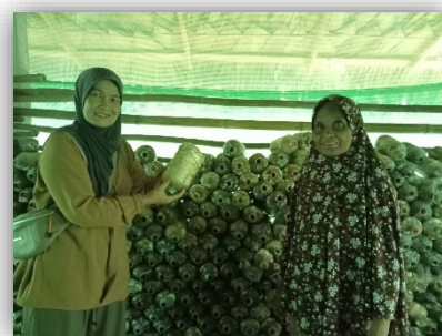
ภาพที่ ๑๓ ภาพตัวอย่างการปฏิบัติงานของอาสาสมัครเกษตรและสหกรณ์ระดับตำบล อำเภอสะบ้าย้อย