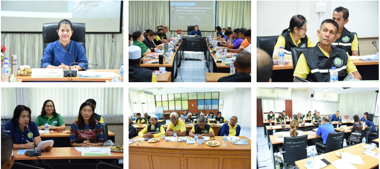
ภาพที่ ๙ การจัดประชุมอาสาสมัครเกษตรและสหกรณ์ระดับตำบล จังหวัดสงขลา ครั้งที่ ๕