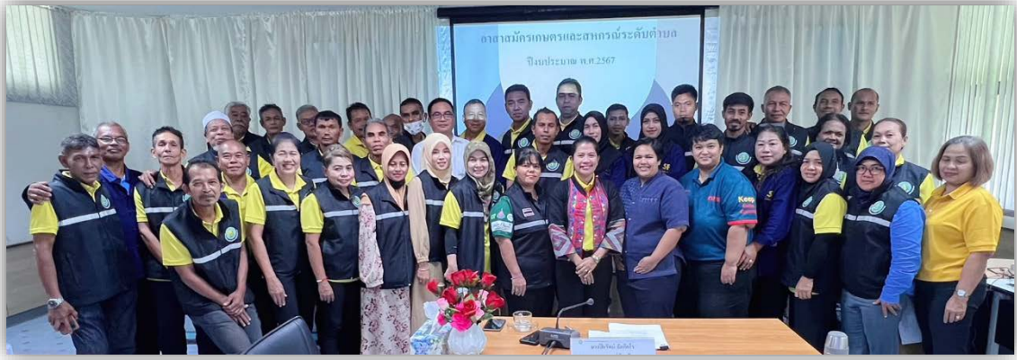
ภาพที่ ๓ การประชุมชี้แจงแนวทางการดำเนินงาน และให้ความรู้แก่อาสาสมัครเกษตรกรและสหกรณ์ระดับตำบล ก่อนปฏิบัติงาน