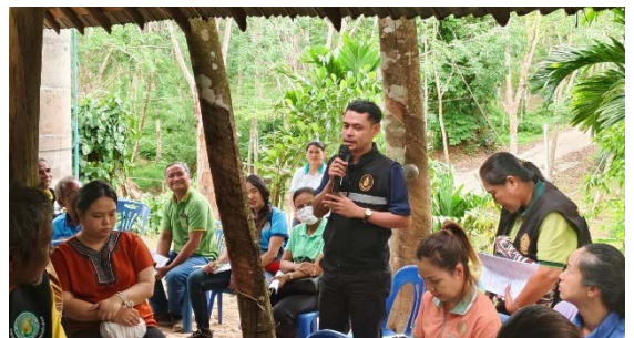
ภาพที่ ๗ การจัดการประชุมอาสาสมัครเกษตรและสหกรณ์ระดับตำบล จังหวัดสงขลา ครั้งที่ ๓