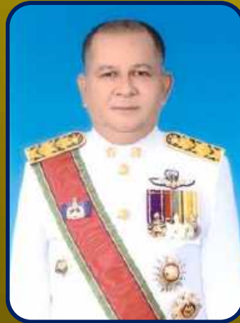
นายมาหะมะพีסקรี วาแหม รองผู้ว่าราชการจังหวัดสงขลา