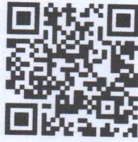
QR Code รายงานการประชุมฯ

รับรองรายงานการประชุมคณะทำงานขับเคลื่อนงานด้านการเกษตรระดับ อำเภอ (SCD) ขับเคลื่อนโครงการขับเคลื่อนการเกษตรระดับหมู่บ้านสู่การผลิต สินค้าเกษตรมูลค่าสูง ประจำปีงบประมาณ ๒๕๖๗