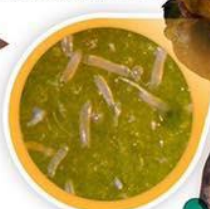
ตัวเต็มวัยของโรสี้ขามะพร้าว ▶ เมื่อมองผ่านกล้องขยาย