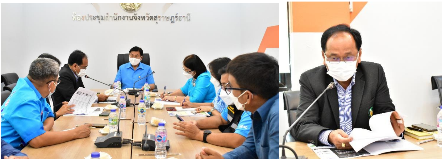
ห้องประชุมสำนักงานจังหวัดสุราษฎร์ธานี

การยางแห่งประเทศไทย ร่วมกับจังหวัดสุราษฎร์ธานี และผู้ประกอบการ ผลักดัน จังหวัดสุราษฎร์ธานี เป็นแหล่งผลิตยางก้อนถ้วยภายใต้มาตรฐานการจัดการสวนยางอย่างยั่งยืน FSC™ ที่ใหญ่ที่สุดในประเทศไทย