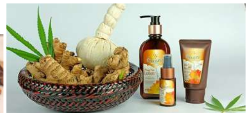
ภาพ/ข่าว : กลุ่มช่วยเหลือเกษตรกรและโครงการพิเศษ

โดย..สำนักงานเกษตรและสหกรณ์จังหวัดสุราษฎร์ธานี