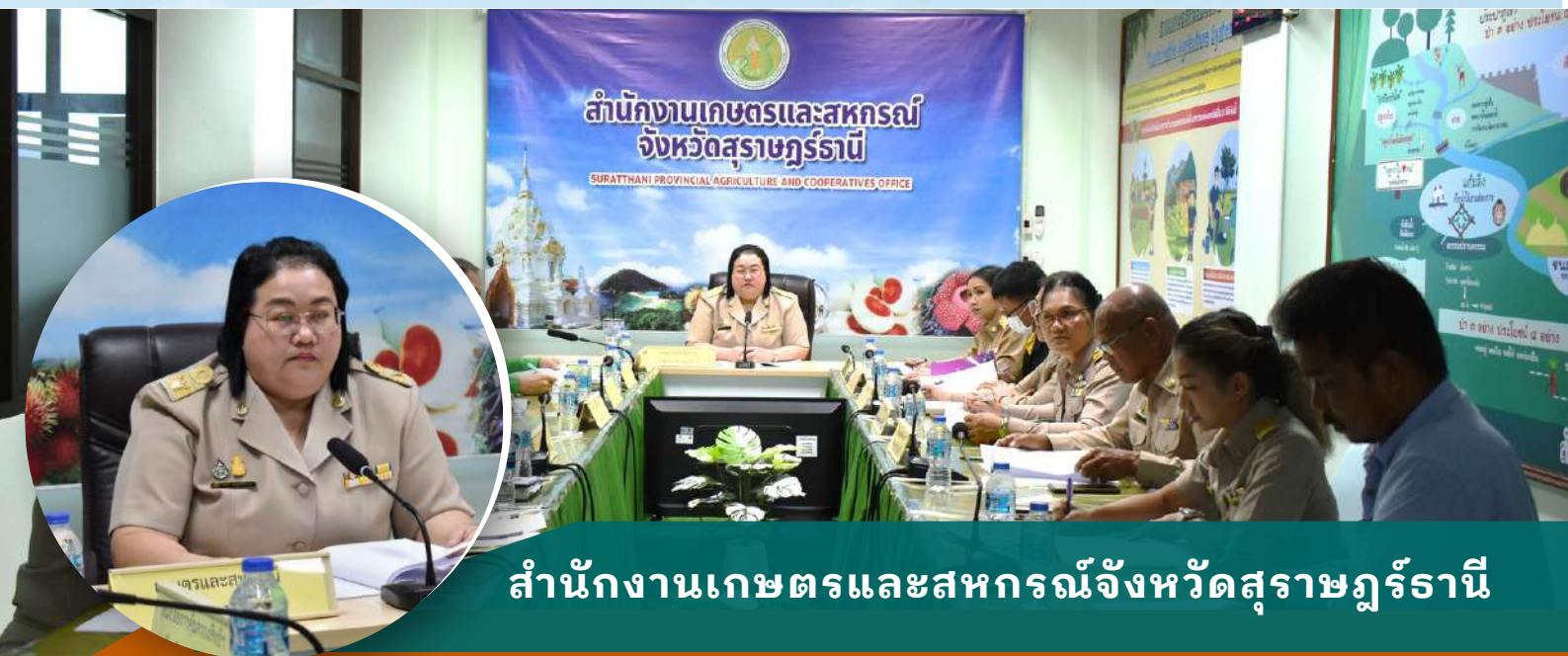
สำนักงานเกษตรและสหกรณ์จังหวัดสุราษฎร์ธานี