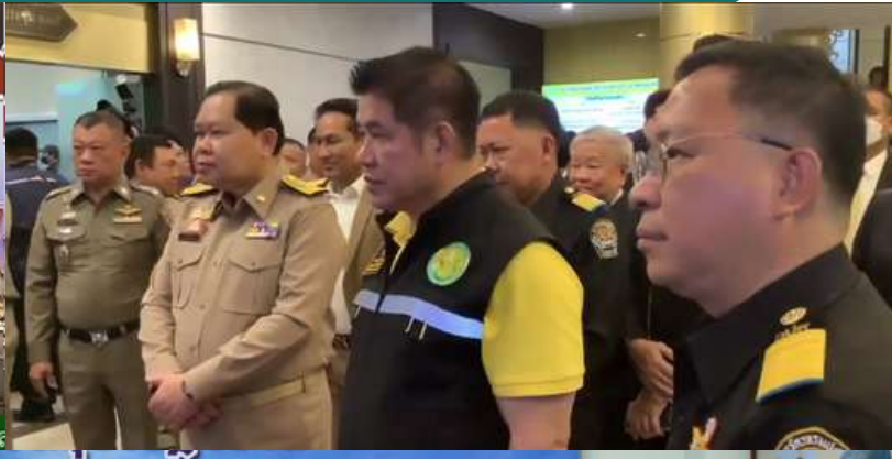
สินค้าเกษตรผิดกฎหมาย วันจันทร์ที่ 25 กันยายน 2566 ณ ห้องประชุมกระทรวงเกษตรและสหกรณ์