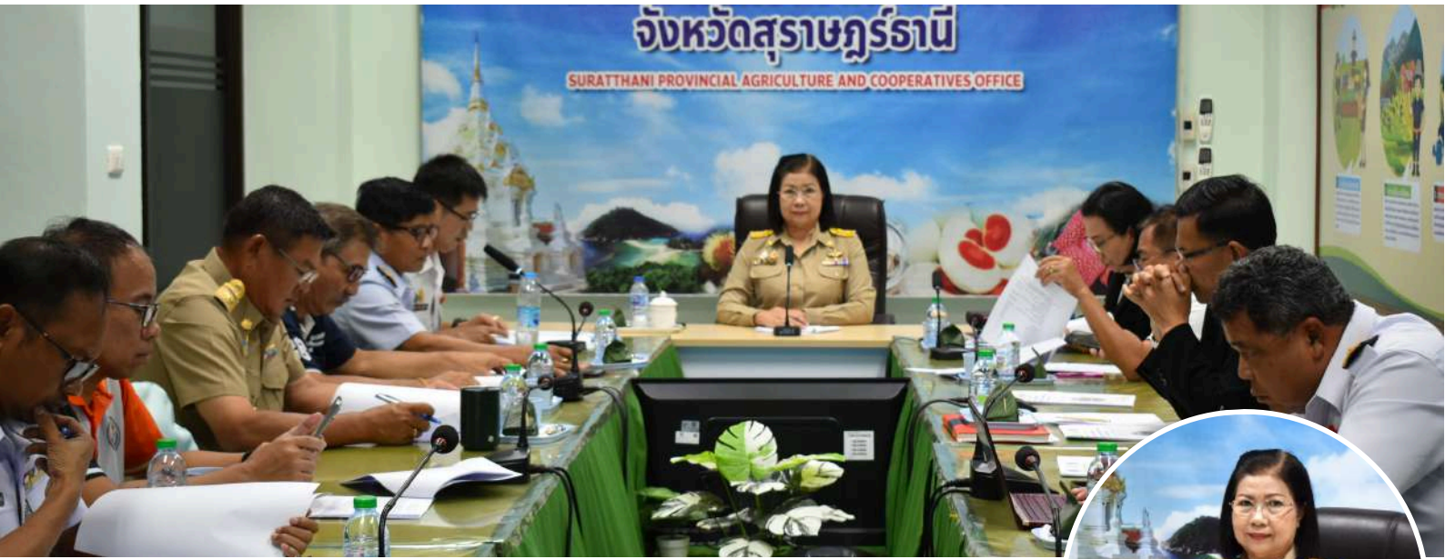
เกษตรและสหกรณ์ จ.สุราษฎร์ธานี ประชุมคณะทำงาน แก้ไขปัญหาการแพร่ระบาดของปลาหมอคางดำจังหวัดสุราษฎร์ธานี

ปีที่ 15 ฉบับที่ 23 | ประจำวันที่ 18 มิถุนายน 2567 |