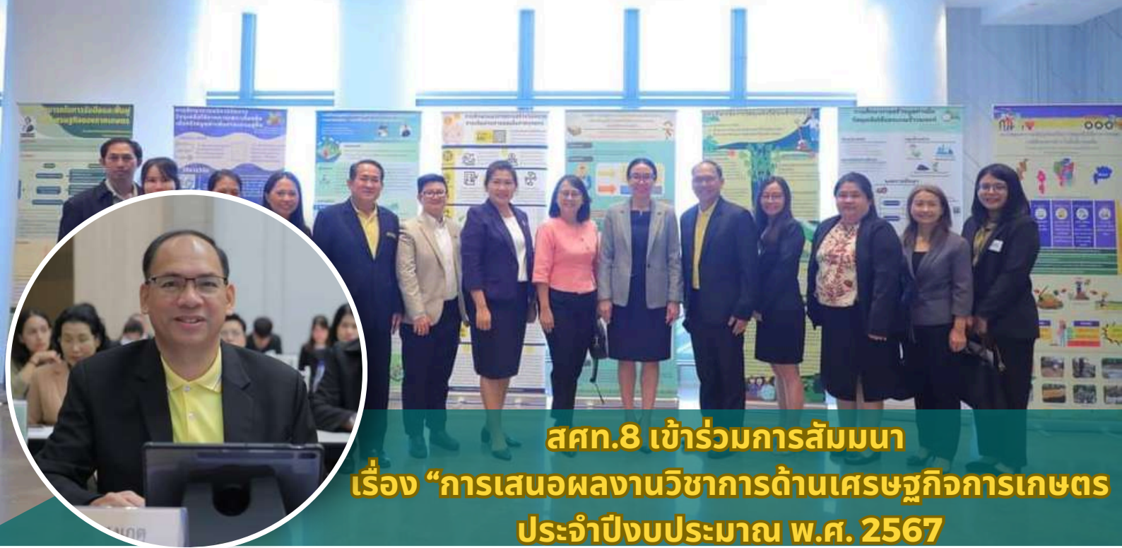
สศท.8 เข้าร่วมการสัมมนา เรื่อง “การเสนอผลงานวิชาการด้านเศรษฐกิจการเกษตร ประจำปีงบประมาณ พ.ศ. 2567”