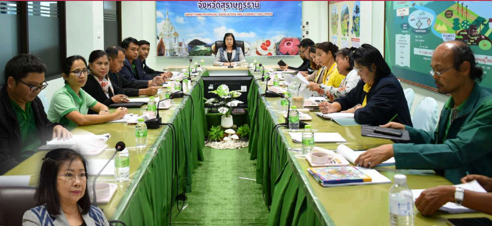
สำนักงานเกษตรและสหกรณ์จังหวัดสุราษฎร์ธานี จัดประชุม คณะกรรมการสรรหาปราชญ์เกษตรของแผ่นดินระดับจังหวัด (สาขาปราชญ์เกษตรดีเด่น)

ปีที่ 15 ฉบับที่ 33 | ประจำวันที่ 28 สิงหาคม 2567 |