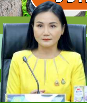
ศ.ดร.นฤมล ภิญโญสินวัฒน์ รมว.กระทรวงเกษตรและสหกรณ์