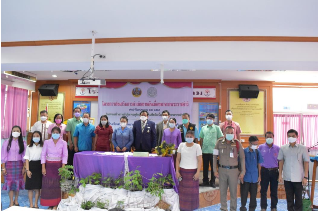
คณะทำงานขับเคลื่อนและสนับสนุนการดำเนินงานตามกรอบการใช้ประโยชน์ ให้เกียรติร่วมในพิธีเปิดโครงการฯ