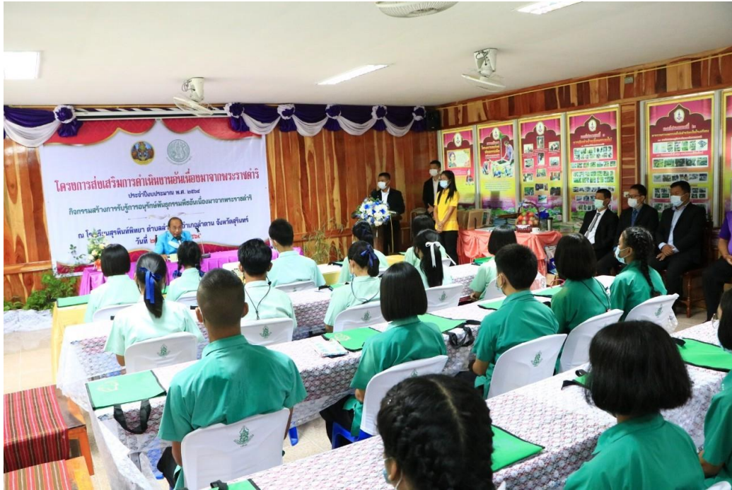
คณะกรรมการขับเคลื่อนและสนับสนุนการดำเนินงานตามกรอบการใช้ประโยชน์ ให้เกียรติร่วมในพิธีเปิดโครงการฯ