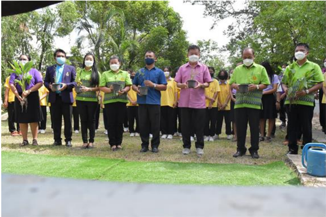
คณะกรรมการขับเคลื่อนและสนับสนุนการดำเนินงานตามกรอบการใช้ประโยชน์ ให้เกียรติร่วมในพิธีเปิดโครงการฯ