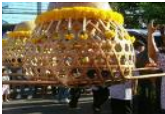
ภาพ : การแห่นางแมวขอฝน

ประเพณีแห่นางแมวของภาคเหนือเหมือนกับภาคอื่นๆ การทำพิธีนั้นจะจับแมวใส่ชะลอมแห่ไปทุกบ้าน ขบวนแห่จะมีการตีฆ้อง กลองให้เสียงอีกทีก็กรีกกรีน ผ่านบ้านใครเจ้าของบ้านจะเอาน้ำสาदनางแมวเพื่อให้นางแมวร้อง ยิ่งทำให้นางแมวร้องดังมากเท่าไรยิ่งดี (งามพิศ, ๒๕๓๖)