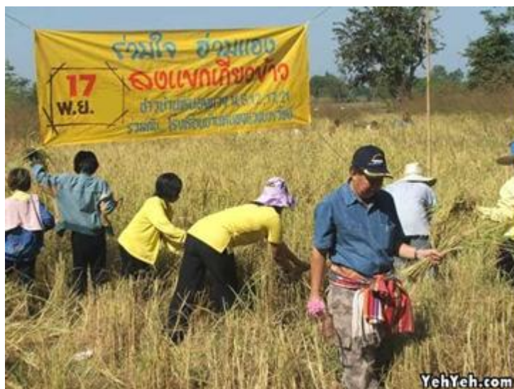
ภาพ : การลงแขกเกี่ยวข้าว

ลานนวดข้าว เป็นลานดินที่ปรับพื้นที่ให้เรียบแล้วเอามูลวัว มูลควายสดละลายน้ำผสมกับเปลือกไม้ ละเลงบนลานจนทั่วให้ปิดดินให้หมด ทาให้หนายังดี เพราะถ้ามีฝนตกลงมาน้ำจะไม่ซึมลงไปถึงดิน พื้นลาน จะไม่เสียหาย เมื่อชนพอนข้าวมายังลาน คนเฒ่าคนแก่จะเป็นผู้เรียงพอนข้าวตั้งแต่ลอมขึ้นไว้ในลานด้านหนึ่ง แล้วจึงลอมพอนข้าวต่อไปให้ตั้งเป็นรูปหมอนขวาน เนื่องจากเมื่อเวลาฝนตก น้ำฝนจะไหลเทไปตามผิว ของลอมข้าว ซึ่งลาดเทเป็นหลังคา บางแห่งเมื่อชนพอนข้าวไปที่ลานนวดจนหมดจะมีพิธีเชิญขวัญข้าว หรือขวัญแม่โพสพ โดยจัดเครื่องกระยาบวช ๒ ชุด แต่ละชุดประกอบด้วย ขนมต้มแดง ต้มขาว ขนมหูช้าง อย่างละ ๑ กระทง กล้วยน้ำว่า ๑ หวี ไข่ต้ม ๑ ฟอง (ผ่าซีก) ข้าวปากหม้อ ๑ ปั้น ผ้าถุงผ้าห่ม (ฝ้ายหรือไหม) อย่างละ ๑ ผืน กระทำพิธีในวันศุกร์ตอนเวลาเย็น เริ่มพิธีจากนำผ้าถุงผ้าห่มปลงบนพื้นนาพร้อมเครื่องสังเวย ๑ ชุดออกมาเช่นไหว้ และเอาสังข์ข้าวมาผูกเป็นหุ่นรูปคนเล็กๆ ๑ ตัวถือไว้ แล้วกล่าวคำเชิญแม่โพสพ