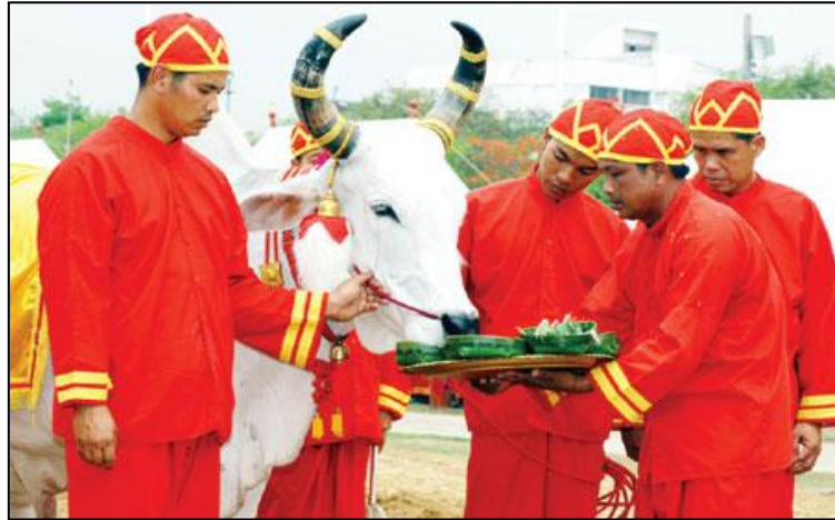
ภาพ : การเสีงทายพระโคกินเสีงในพระราชพิธีพืชมงคลจรดพระนังคัลแรกนาขวัญ