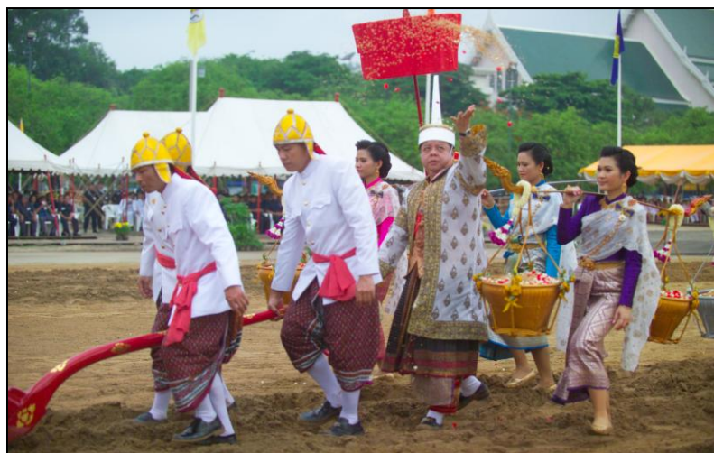
ภาพ : พระยาแรกนากำลังหว่านข้าวในพระราชพิธีพืชมงคลจรดพระนังคัลแรกนาขวัญ

และนับตั้งแต่ปี พ.ศ.๒๕๐๙ เป็นต้นมา คณะรัฐมนตรีได้ประชุมปรึกษาลงมติให้วัน พระราชพิธีพืชมงคลจรดพระนังคัลแรกนาขวัญเป็นวันเกษตรกรประจำปีอีกด้วย ทั้งนี้เพื่อให้ผู้มีอาชีพทาง การเกษตรได้ระลึกถึงความสำคัญของการเกษตร และร่วมมือกันประกอบพระราชพิธีพืชมงคลจรดพระนังคัล แรกนาขวัญเพื่อเป็นสิริมงคลแก่อาชีพของตน ก่อให้เกิดประโยชน์แก่เศรษฐกิจของประเทศชาติ จึงได้จัดงาน วันเกษตรกรควบคู่ไปกับงานพระราชพิธีจรดพระนังคัลแรกนาขวัญจนถึงปัจจุบัน (สถาบันวิจัยข้าว, ๒๕๔๒)