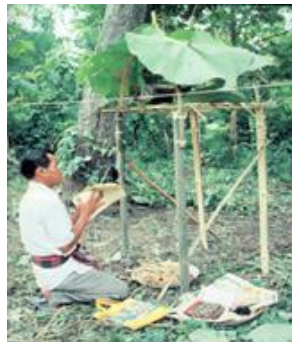
ภาพ : การทำพิธีเสีงผีตาแฮก

สถาบันวิจัยข้าว (๒๕๔๕) กล่าวว่า พิธีเสีงตาแฮก หลังจากทำบุญข้าวสากแล้วจะกำหนดเอาวันพุธแรกเป็นวันตั้งศาลตาแฮก หรือตูปตาแฮก โดยนำดอกไม้ไผ่มาสานขัดแตะเป็นตารางห่างๆ แผ่นกว้างยาวพอประมาณ แล้วพันทบขึ้นปลายมัดติดกันเป็นรูปสามเหลี่ยม ได้เป็นตูปตาแฮก และเสียบตูปตาแฮกลงบนเสาไม้ไผ่ แล้วปักลงบนแปลงตาแฮก โดยให้อยู่สูงจากพื้นดินประมาณ ๑ เมตร นำดอกไม้ไผ่ที่ขัดเป็นรูปกำไลคล้องต่อกันยาวประมาณวาเศษแล้วคล้องบนปลายยอดเสาตูปตาแฮก หลังจากตั้งตูปตาแฮกเสร็จก็จึงนำเครื่องเช่นไห้วใส่ไว้ในตูป ประกอบด้วยของหวาน ได้แก่ ข้าวสาก ข้าวต้มมัดคลูกมะพร้าวชูด ของคาว ได้แก่ แจ่ว ปลา หรือกบ หรือเขียดปิ้ง เหล้า หมากพลู บุหรี่ กล่าวบนบานขอให้ตาแฮกคุ้มครองให้ข้าวในนาสมบูรณ์ดี