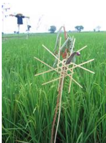
ภาพ : ตาเหลว เป็นเครื่องรางที่ช่วยให้น้ำข้าวคลาดแคล้วจากภัยพิบัติ

แหกหว่าน ก่อนจะนำเมล็ดข้าวพันธุ์ไปหว่าน ต้องมีการหาวันที่เหมาะสมกับการหว่านตามตำรา ได้แก่ วันจันทร์ วันพุธ วันพฤหัสบดี และวันศุกร์ ในวันเหล่านี้ วันพุธถือเป็นวันที่ดีที่สุด รองลงมาคือวันศุกร์ สำหรับการหว่าน ให้หันหน้าไปทางทิศตะวันตก แล้วกลับตาหว่านสัก ๔ - ๕ กำมือ จากนั้น จึงค่อยล้มตาหว่านต่อไป ด้วยถือเคล็ดที่ว่าสัตว์ที่เป็นศัตรูพืชไม่สามารถมองเห็นข้าว กล้าที่หว่านและจะได้ไม่มารบกวนเมื่อหว่านเสร็จ ทำการประกอบพิธี "วางควัภรณ์" คือ วางกระทงใบตองที่บรรจุ "เข้าบ้านกล้วยหน่วย" (ข้าวเหนียวหนึ่งก้อน กล้วยสุกหนึ่งลูก) เพื่อบอกกล่าวพระแม่ธรณีเป็นการฝากฝังให้ช่วยดูแลต้นกล้าให้เจริญงอกงามดี ไม่มีศัตรูพืชมาเบียดเบียน จากนั้นอาจนำต้นเอื้องหมายนามาปักเพื่อแสดงเครื่องหมายบอกความเป็นเจ้าของ พร้อมปักตาเหลว เอี่ยม (๒๕๕๑) ได้อธิบายว่า ตาเหลว เป็นสัญลักษณ์ที่ชาวนานิยมใช้ในพิธีกรรมทั่วไป เช่น การต้มยาสมุนไพร การป้องกันผีขโมยข้าว และการป้องกันศัตรูข้าว เป็นต้น