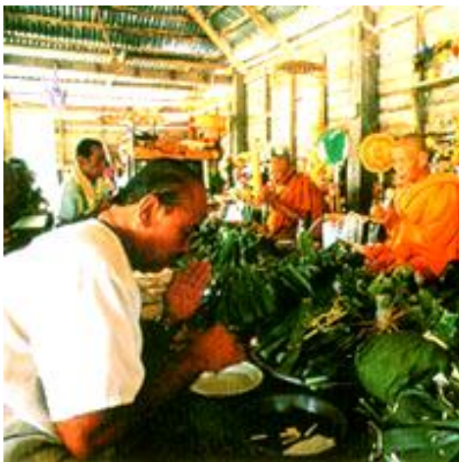
ภาพ : ประเพณีบุญข้าวประดับดิน

ชมรมศิลปวัฒนธรรมอีสาน (๒๕๕๑) กล่าวว่า ประเพณีบุญข้าวประดับดินเป็นประเพณีการทำบุญเพื่ออุทิศส่วนกุศลให้แก่เปรต หรือญาติพี่น้องที่ตายไปแล้ว ข้าวประดับดินจะประกอบด้วย ข้าว อาหารคาวหวาน หมากพลูและบุหรี ซึ่งเราห่อหรือใส่กระถงไปวางไว้ตามพื้น หรือแขวนไว้ตามต้นไม้ในบริเวณวัด สาเหตุที่ทำให้เกิดบุญข้าวประดับดินมีว่า ครั้งสมัยพุทธกาล มีญาติของพระเจ้าพิมพิสารไปกินอาหารของพระสงฆ์ตายไปแล้วจึงเกิดเป็นเปรต เมื่อพระเจ้าพิมพิสารไปถวายทานแด่พระพุทธเจ้าและพระสงฆ์แล้ว มิได้อุทิศส่วนกุศลไปให้ ถึงเวลากลางคืนจึงพากันมาส่งเสียงรบกวนเพื่อขอส่วนบุญ พระเจ้าพิมพิสารจึงไปทูลถามพระพุทธเจ้า พระพุทธเจ้าทรงแจ้งเหตุให้ทราบ เมื่อพระเจ้าพิมพิสารทรงทราบ จึงถวายสังฆทานแล้วอุทิศส่วนบุญส่วนกุศลไปให้ญาติพี่น้อง จึงทำให้เกิดเป็นประเพณีบุญข้าวประดับดินขึ้น การทำพิธีทำบุญข้าวประดับดิน ในวันแรม ๑๓ ค่ำ เดือน ๙ ญาติโยมนิยมถวายทาน รักษาศีล ฟังเทศน์ และมีการเตรียมอาหารคาวหวาน หมากพลู บุหรี โดยห่อด้วยใบตองหรือใส่กระถง รุ่งเช้าในวันแรม ๑๔ ค่ำ เวลาประมาณ ๔ ถึง ๕ นาฬิกา นำห่อหรือกระถงที่เตรียมไว้ไปถวายหรือแขวนในบริเวณวัด ในการวางสิ่งของเพื่ออุทิศให้เปรตหรือญาติมิตรที่ล่วงลับไปแล้ว