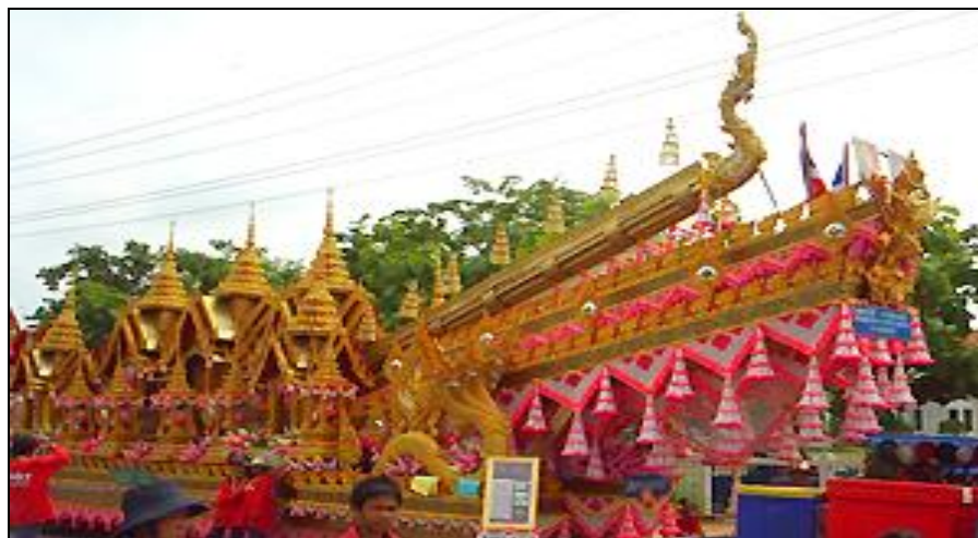
ภาพ : ประเพณีบุญบั้งไฟ