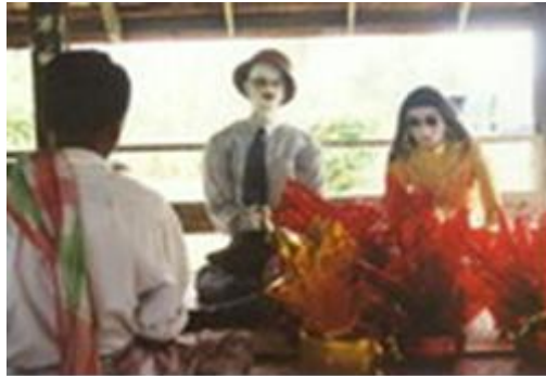
ภาพ : หุ่นฟางเจ้าบ่าวเจ้าสาว

สถานที่นัดหมายก็จะนำเอาหุ่นโຕ้ะชุมพุกทั้งหมดมาหาคว่า หุ่นผู้ชายหมู่บ้านใดจะได้คู่แต่งงานกับหุ่นเจ้าสาวของหมู่บ้านใด โดยการหยิบฉลากจากประธานจัดงาน เมื่อได้คู่แล้วก็เริ่มพิธีแต่งงานเหมือนพิธีแต่งงานของคนโดยทั่วไป หลังจากได้คู่แล้วชาวบ้านในหมู่บ้านเจ้าของหุ่นก็ได้เป็นญาติเกี่ยวดองกัน ซึ่งเป็นการเสริมสร้างความสามัคคีให้เกิดขึ้นอีกทางหนึ่ง ประเพณีลาซัง - โຕ้ะชุมพุก ของอำเภอปะนาเระ จังหวัดปัตตานี นับว่าเป็นประเพณีปฏิบัติอย่างหนึ่ง ที่มีคุณค่าทางวัฒนธรรม ได้เห็นการทำงานร่วมกันของคนในท้องถิ่นที่เปี่ยมไปด้วยความสมัครสมานสามัคคี และที่สำคัญที่สุดคือ ความเป็นยอดแห่งความกตัญญูทเวที ที่มีต่อพระแม่โพสพซึ่งเป็นเทพแห่งข้าว (นิรนาม, ๒๕๕๑)