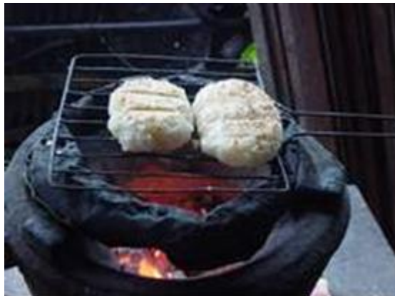
ภาพ : การปิ้งข้าวหรือจีข้า

เป็นการทำบุญในช่วงเดือนสาม วันมาฆบูชาโดยชาวบ้านมาร่วมกันทำบุญตักบาตรด้วยข้าวจี พร้อมกับภัตตาหารอื่นๆ เมื่อพระฉันเสร็จแล้วจะมีการเทศน์ฉลองข้าวจี และรับพร เหตุที่มีการทำบุญข้าวจีเนื่องมาจากสมัยพุทธกาลมีนางทาสชื่อ ปุณณทาสี ได้นำแบ่งข้าวจี ทำจากแบ่งทำขนมเงินไปถวายพระพุทธเจ้า แต่นางคิดว่าแบ่งข้าวจีเป็นอาหารของคนต่ำต้อย พระพุทธองค์คงไม่ฉัน ซึ่งพระพุทธเจ้าทรงหยั่งรู้อิฐิตใจนาง จึงได้ฉันข้าวจีต่อหน้านาง ทำให้นางดีใจมาก ชาวอีสานจึงได้แบบอย่างการทำข้าวจี และพากันทำบุญด้วยข้าวจีถวายพระในช่วงเดือนสาม มาโดยตลอดในปัจจุบันชาวอีสานส่วนใหญ่ใช้ข้าวเหนียวสุกมาปั้นเป็นก้อน แล้วนำไปปิ้งหรือย่าง (จี) บนไฟอ่อนๆ อาจจะทาด้วยไข่ หรือใส่ไส้ด้วยน้ำอ้อย เพื่อให้มีสีและรสชาติที่น่ารับประทานมากยิ่งขึ้น