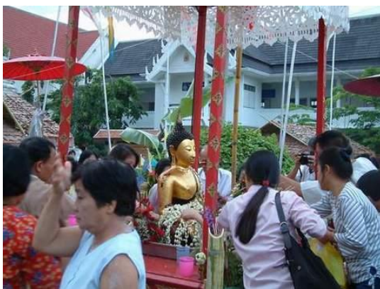
ภาพ : พระเจ้าฝนแสนห่า

พระเจ้าฝนแสนห่า เป็นพระพุทธรูปปางมารวิชัยแบบเชียงแสน เข้าใจว่าคงมีการสร้างพระเจ้าฝนแสนห่าไว้หลายแห่งเพื่อใช้ในพิธีขอฝน โดยการแห่ไปในที่ต่างๆ ตลอดทางชาวบ้านจะเอาน้ำขมิ้นส้มป่อยมาสรองค์พระ เมื่อแห่เสร็จก็นำกลับมาคืนวัดตั้งไว้ให้ประชาชนมาสรงน้ำตามประเพณี ที่จังหวัดเชียงใหม่เมื่อมีการแห่ขอฝนมีพิธีจะแห่สรงน้ำพระพุทธรูทสิงค์ ที่วัดพระสิงห์ด้วยเพราะเชื่อในพุทธานุภาพว่าจะลดบันดาลให้ฝนตกตามฤดูกาล (งามพิศ, ๒๕๓๖)