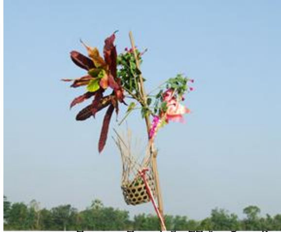
ภาพ : ชะลอมที่บรรจุเครื่องเซ่นในพิธีทำขวัญแม่โพสพ