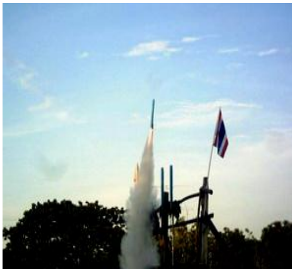
ภาพ : การจุดบั้งไฟขอฝน