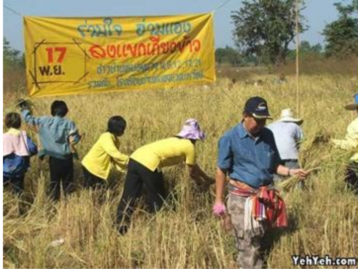
ภาพ : การลงแขกเกี่ยวข้าว

ลานนวดข้าว เป็นลานดินที่ปรับพื้นที่ให้เรียบแล้วเอามูลวัว มูลควายสดละลายน้ำผสมกับเปลือกไม้ ละเลงบนลานจนทั่วให้ปิดดินให้หมด ทาให้หนายังดี เพราะถ้ามีฝนตกลงมาน้ำจะไม่ซึมลงไปถึงดิน พื้นลาน จะไม่เสียหาย เมื่อชนพอนข้าวมายังลาน คนเฒ่าคนแก่จะเป็นผู้เรียงพอนข้าวตั้งแต่ลอมขึ้นไว้ในลานด้านหนึ่ง แล้วจึงลอมพอนข้าวต่อไปให้ตั้งเป็นรูปหมอนขวาน เนื่องจากเมื่อเวลาฝนตก น้ำฝนจะไหลเทไปตามผิวของ ลอมข้าว ซึ่งลาดเทเป็นหลังคา บางแห่งเมื่อชนพอนข้าวไปที่ลานนวดจวนหมดจะมีพิธีเชิญขวัญข้าว หรือ ขวัญแม่โพสพ โดยจัดเครื่องกระยาบวช ๒ ชุด แต่ละชุดประกอบด้วย ขนมต้มแดง ต้มขาว ขนมहुช้าง อย่าง ละ ๑ กระทง กล้วยน้ำว่า ๑ หวี ไข่ต้ม ๑ ฟอง (ผ่าซีก) ข้าวปากหม้อ ๑ ปั้น ฝ้านุ่นฝ้าห่ม (ฝ้ายหรือไหม) อย่าง ละ ๑ ผืน กระทำพิธีในวันศุกร์ตอนเวลาเย็น เริ่มพิธีจากนำฝ้านุ่นฝ้าห่มปลูกลงบนพื้นนาพร้อมเครื่องสังเวย ๑ ชุดออกมาเช่นไหว้ และเอาข้งข้าวมาผูกเป็นหุ่นรูปคนเล็กๆ ๑ ตัวถือไว้ แล้วกล่าวคำเชิญแม่โพสพ จากนั้น ทิ้งเครื่องสังเวยพร้อมกับข้าวที่เกี่ยวข้องแล้วส่วนหนึ่งเพื่อเป็นทานแก่นกกา จากนั้นพาหุ่นรูปคนเข้ามายังลานนวด ข้าว คลี่ฝ้านุ่นฝ้าห่มสำหรับนั้นคลุมลงบนกองพอนข้าว แล้วเอาหุ่นปักไว้บนฝ้า เพื่อสมมุติว่าแต่งตัวให้แก่แม่ โพสพ นำเอาเครื่องสังเวยอีกชุดหนึ่งมาเช่น และบอกกล่าว สิ่งต่างๆ ตามที่คิดว่าเป็นมงคลแก่การทำมาหากิน เป็นอันเสร็จพิธี (สถาบันวิจัยข้าว, ๒๕๔๕)