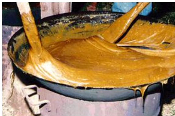
ภาพ : การกวนข้าวทิพย์

ปัจจุบันประเพณีกวนข้าวทิพย์ทำขึ้นเพียงบางแห่ง เนื่องในโอกาสสำคัญ เพื่อเป็นการสืบสาน รักษาวัฒนธรรม ประเพณีโบราณเท่านั้น เช่น วันวิสาขบูชา เนื่องจาก ข้าวทิพย์ หรือข้าวมธุปายาส ถือเป็นข้าวแห่งการตรัสรู้ พิธีกวนข้าวทิพย์เริ่มต้นตั้งแต่การบวงสรวงอัญเชิญเทวดา นางฟ้า นำของอันเป็นมงคล (ของทิพย์) จำนวน ๑๐๘ ชนิด เข้าสู่ราชวัตรฉัตรธง แล้วลงยันต์กระตะและพายมีพิธีเจริญพระพุทธมนต์จากนั้นประธานในพิธีรับศีลและจุดไฟ มงคลที่เตากวนข้าวทิพย์ พระสงฆ์สวดชุมนุมเทวดาและเจริญพุทธมนต์ สาวพรหมจารีย์ ซึ่งสมมุติเป็นนางฟ้า อัญเชิญของทิพย์ลงกระตะ พระสงฆ์สวดเจริญชัยมงคล (สถาบันวิจัยข้าว, ๒๕๔๕)นอกจากนี้ในจังหวัดสิงห์บุรี ยังคงรักษาประเพณีกวนข้าวทิพย์ โดยมีเหลืออยู่เพียง ๓ หมู่บ้าน คือ หมู่บ้านพัฒนาโกศาภิวัฒน์ หมู่บ้านวัดกุฎีทอง และหมู่บ้านในอำเภอพรมบุรี ซึ่งยังคงรักษาประเพณี และมีความเชื่อถืออย่างมั่นคง เป็นแบบอย่างที่ดี ผ่างด้วยจริยธรรมและคตินิยมอยู่มากและมีความพร้อมเพรียงของชาวบ้านที่ทำนา (นิรนาม, ๒๕๕๑.)