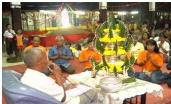
ภาพ : พิธีทำบุญกองข้าว

ประเพณีนี้ชาวบ้านนำข้าวเปลือกมารวมกันไว้ที่บริเวณงาน ประดับกองข้าวด้วยข้าวตอกดอกไม้ แล้วนำด้ายสายสิญจน์ ๙ เส้นไปล้อมกองข้าวเปลือกไว้ นิมนต์พระสงฆ์สวดมนต์ทำบุญกองข้าวเปลือกกลางคืนมีมหรสพ ตอนเช้าทำบุญตักบาตร และนำข้าวที่รวบรวมไว้ไปขายนำเงินที่ได้มอบให้วัด