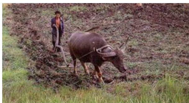
ภาพ : การไถนาด้วยควาย

ที่อำเภอหนองบัว จังหวัดนครสวรรค์ หลังจากผ่านพ้นการทำพิธีแรกนาแล้ว พร้อมกับเริ่มมีฝนตกลงมา เป็นช่วงเวลาที่เหมาะต่อการไถนา โดยก่อนชาวนาเริ่มการไถนา จะมีประเพณีไถอาสา ซึ่งเป็นประเพณีเฉพาะถิ่น โดยชายหนุ่มจะทำไถจากไม้ประดู่ เรียกว่าไถอาสา เพื่อนำไปยังนาของหญิงสาวคนรัก ส่วนฝ่ายหญิงสาวจะต้องเย็บเสื่อให้แก่ชายหนุ่ม ๑ ตัว สำหรับใช้เป็นชุดไถอาสา จากนั้นฝ่ายชายหนุ่มใส่เสื่อพร้อมนั่งโจงกระเบน แล้วทำการไถนาด้วยไถอาสาของตนเอง เป็นเวลา ๗ วัน ส่วนไถอาสาที่ทำขึ้นนี้ถือเป็นมรดกสืบทอดกันไปยังลูกหลานต่อไป (สถาบันวิจัยข้าว, ๒๕๕๕)