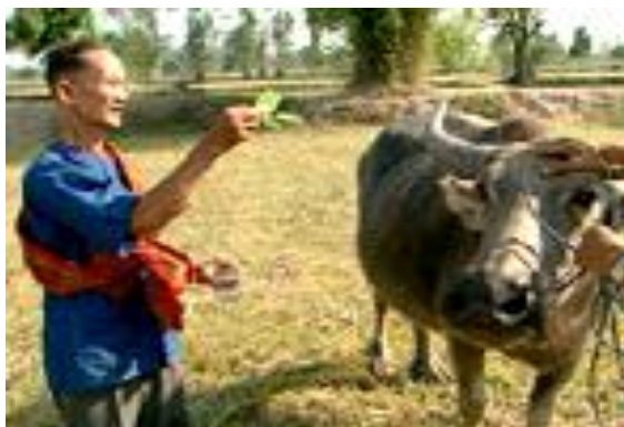
ภาพ : หมอทำขวัญควาย

นอกจากนี้ สถาบันวิจัยสังคม มหาวิทยาลัยเชียงใหม่ (๒๕๔๗) ได้กล่าวถึง ประเพณีสู่ขวัญควายของชาวล้านนาว่า ในการทำงานแต่ก่อนใช้แรงควายเป็นหลักในการไถ ใช้วัวไถนามีบ้างแต่มีไม่มาก อาจเป็นเพราะควายมีกำลังดีมากกว่า และมีนิสัยชอบน้ำชอบโคลน ในระหว่างที่ไถนาให้คนได้ปลุกข้าวกินนั้นควายมักจะถูกตีถูกตำตะคอกทุกวัน ดังนั้นเมื่อเสร็จจากการไถแล้ว เจ้าของควายนึกถึงการกระทำของตนต่อควาย ก็ล้วนจะเป็นบาปกรรมติดตัว จึงได้แต่งเครื่องขอขมาสู่ขวัญควาย มีบายศรีปากชาม กรวยดอกไม้ สายสิญจน์ น้ำส้มป่อย กล้วยอ่อน ข้าวสุก ไข่ต้ม ๒ ตัว เหล้า ๑ ไห หรือ ๑ ขวด ขนมต่างๆ เมื่อถึงเวลาที่จะประกอบพิธีสู่ขวัญควาย เจ้าของจะนำควายไปอาบน้ำให้สะอาด และนำมาผูกไต้ร่มไม้ หรือในคอก แล้วปูเสื่อสำหรับตั้งเครื่องสู่ขวัญ จากนั้นอาจารย์ประจำหมู่บ้านที่เชิญมาทำพิธีกล่าวพรรณนาถึงการทำงาน กล่าวถึงคุณของควาย และกล่าวขอโทษควายที่ได้ดุด่าเข่นขยี้ เมื่อกล่าวจบผู้ทำพิธีเอากรวยดอกไม้ผูกติดกับเขาควาย ทั้ง ๒ ข้างด้วยสายสิญจน์ เอน้ำส้มป่อยประพรมตัวควาย พร้อมกับกล่าวให้พรแก่ควายให้มีสุขภาพดี มีลูกหลานตัว แล้วเอากล้วยอ่อนวางให้ควายกินเป็นอันเสร็จพิธี