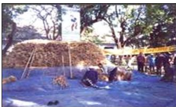
ภาพ : ประเพณีบุญคุณลาน

เป็นประเพณีที่เกี่ยวกับการทำขวัญข้าวเพื่อเป็นสิริมงคลแก่ข้าว หรือเรียกว่า พิธีเรียกขวัญข้าว จะเป็นพิธีที่ทำก่อนขนข้าวขึ้นยุ้ง งานประเพณีบุญคุณลานจะมีประมาณเดือนยี่ โดยจะนิมนต์พระสงฆ์ไปเทศน์ที่ลานนวดข้าว มีการทำบุญตักบาตรเลี้ยงพระ ประพรมน้ำพระพุทธมนต์แก่ชาวบ้าน ลานนวดข้าวที่นา ต้นข้าว ถือเป็นสิริมงคลแก่ข้าว ทำให้ข้าวในนาอุดมสมบูรณ์ ซึ่งเชื่อว่า จะทำให้เจ้าของอยู่เย็นเป็นสุข ฝนตกต้องตามฤดูกาล ข้าวกล้าจะงอกงามและได้ผลดีในปีต่อไป เมื่อเสร็จพิธีทำบุญคุณลานแล้วชาวบ้านจะขนข้าวใส่ยุ้งฉาง และเชิญขวัญข้าว คือ พระแม่โพสพไปยังยุ้งฉางข้าว และทำพิธีสู่ขวัญข้าว สู่ขวัญเล่าข้าว เพื่อเป็นสิริมงคลต่อไป ปัจจุบันประเพณีนี้เกือบหายไปหาดูได้ยากไม่ได้แล้ว เนื่องจากการนำเทคโนโลยีสมัยใหม่เข้ามาใช้ เช่น ใช้เครื่องนวดข้าวแทนการนวดด้วยมือ ทำให้ไม่ต้องมีลานนวดข้าว