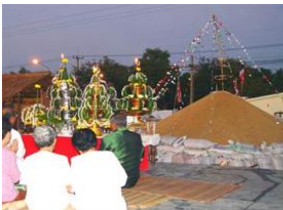
ภาพ : ประเพณีสู่ขวัญข้าว

คาวหวานต่างๆ แล้วให้หมอสู่ขวัญทำพิธีสู่ขวัญข้าว เพื่อเชิญแม่โพสพให้มาสิงอยู่ในข้าว เป็นสิริมงคลแก่ข้าว คล้ายกับการทำพิธีสู่ขวัญทั่วไป (สถาบันวิจัยข้าว, ๒๕๔๕)