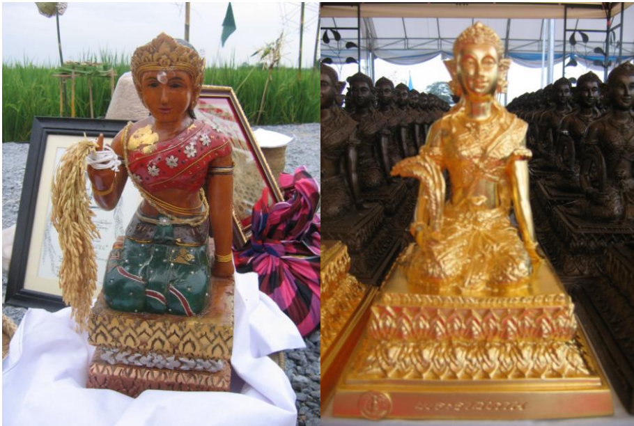
ภาพ : องค์แม่โพสพ

พิธีกรรมที่เกี่ยวกับข้าวมีความสำคัญต่อชาวบ้านมากที่สุด เพราะเกี่ยวข้องกับการทำมาหากินเลี้ยงชีพ พิธีกรรมข้าวจัดขึ้นอย่างต่อเนื่องตลอดปีตามลำดับการเพาะปลูกข้าว โดยช่วงที่สำคัญที่สุดอยู่ระหว่าง หลังการเก็บเกี่ยวผลผลิตและก่อนเริ่มฤดูกาลใหม่ พิธีกรรมข้าวในแต่ละภาคส่วนใหญ่มีความคล้ายคลึงกัน แต่ บางอย่างก็มีความแตกต่างกันบ้างตามแต่ความเชื่อในแต่ละพื้นที่ แต่สิ่งที่ชาวนามีความเชื่อเหมือนกันมา ตั้งแต่โบราณคือ ความเชื่อเกี่ยวกับ “แม่โพสพ”