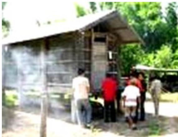
ภาพ : ประเพณีเปิดยุ้ง

เฝ้ากับนา ตักตวงข้าวให้ได้ร้อยเกวียน พันเกวียน” จากนั้นจึงทำการตักตวงข้าวในยุ้งขายต่อไปได้ โดยจะไม่เปิดยุ้งตวงข้าวขายในวันศุกร์ สำหรับข้าวที่ตักไว้ชั้นหนึ่งนั้น ให้นำเอาไปสีซ้อมเป็นข้าวสาร แล้วหุงใส่บาตรถวายพระสงฆ์ให้หมดสิ้นไป (สถาบันวิจัยข้าว, ๒๕๔๕)