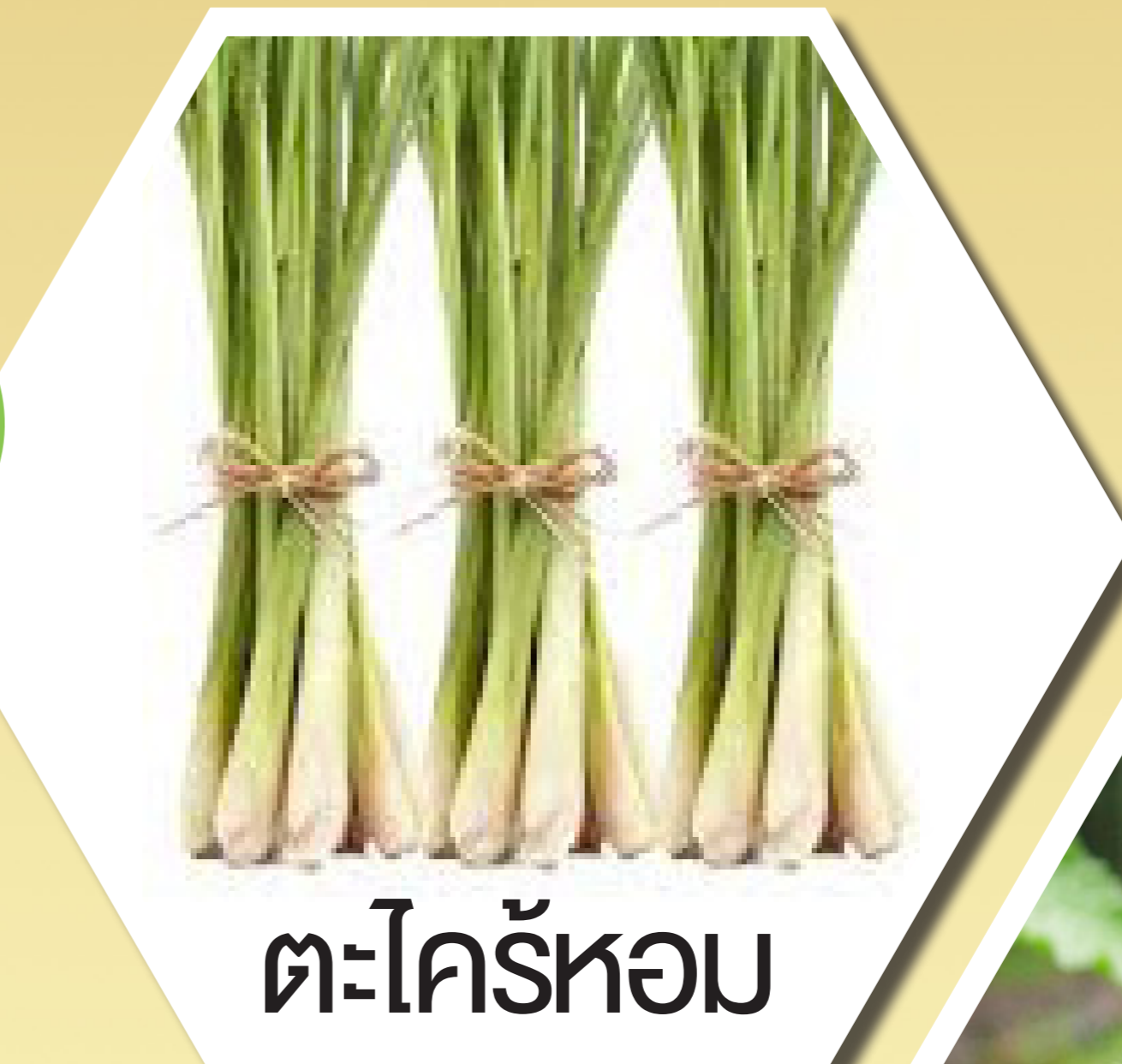
ตะไคร้หอม