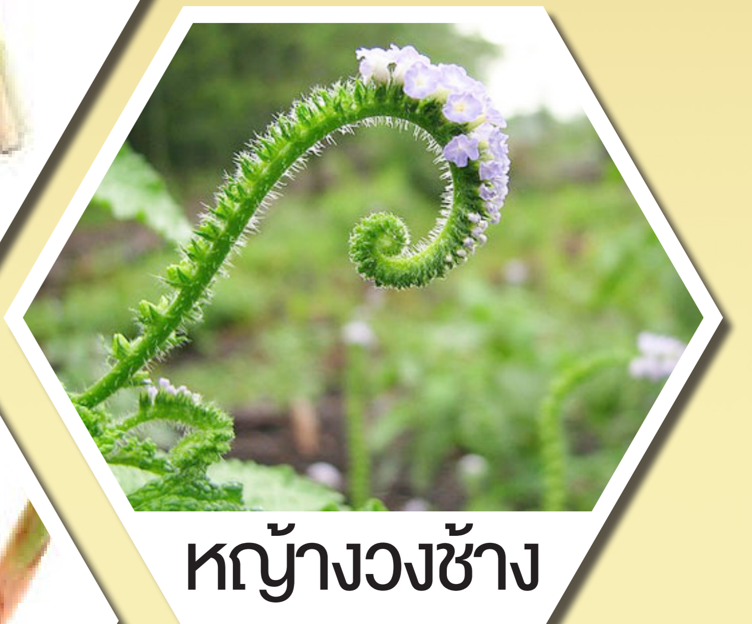
หญ้างวงช้าง