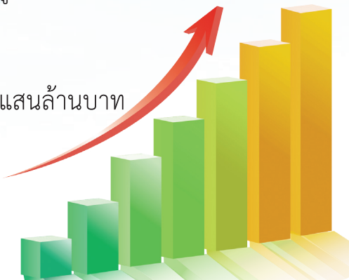
มูลค่าของผลิตภัณฑ์สมุนไพรเพิ่มขึ้นเป็น 3.2 แสนล้านบาทภายใน 5 ปี