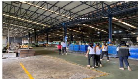
ภาพที่ ๕ การดำเนินงานการแก้ไขปัญหาข้อร้องเรียนเรื่องกลิ่นจากโรงงานผลิตยางพารา