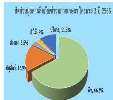
ภาพที่ ๑ สัดส่วนมูลค่าผลิตภัณฑ์รวมภาคเกษตร ไตรมาส ๓ ปี ๒๕๖๕ ที่มา : สำนักงานเศรษฐกิจการเกษตรที่ ๓ (๒๕๖๕)

ดัชนีผลผลิตสินค้าเกษตรอยู่ที่ระดับ ๑๓๘.๖ เพิ่มขึ้นร้อยละ ๑๗.๓ เมื่อเทียบกับปีที่ผ่านมา เนื่องจากสภาพอากาศเอื้ออำนวยและปริมาณน้ำเพียงพอต่อการผลิต ประกอบกับความต้องการสินค้าเพิ่มขึ้น ส่งผลให้ผลผลิตสินค้าเกษตรที่สำคัญ ได้แก่ มันสำปะหลัง ยางพารา โคเนื้อ ไก่ กระบือการเพาะเลี้ยงสัตว์น้ำจืดและการจับสัตว์น้ำจืดจากธรรมชาติ มีผลผลิตเพิ่มขึ้น ส่วนดัชนีราคาที่เกษตรกรขายได้อยู่ที่ระดับ ๑๓๐.๖ เพิ่มขึ้นร้อยละ ๑๐.๓ เนื่องจากราคาสินค้าเกษตรสำคัญที่เพิ่มขึ้น ได้แก่ มันสำปะหลัง ยางพารา สุกร โคเนื้อ กระบือและไก่ส่งผลให้ดัชนีรายได้เกษตรกรอยู่ที่ระดับ ๑๘๑.๐ เพิ่มขึ้นร้อยละ ๒๙.๔