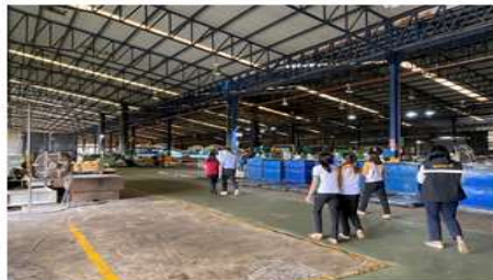
ภาพที่ ๕ การดำเนินงานการแก้ไขปัญหาข้อร้องเรียนเรื่องกลิ่นจากโรงงานผลิตยางพารา