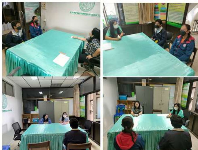
ภาพที่ ๓ การดำเนินงานกองทุนหมุนเวียนเพื่อการช่วยเหลือเกษตรกรและผู้ยากจน (อบก.) ส่วนจังหวัดอุดรธานี