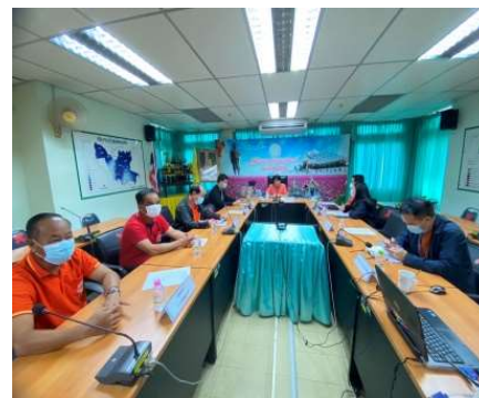
ภาพที่ ๒ การประชาสัมพันธ์สร้างการรับรู้การป้องกันและแก้ไขปัญหาการเผาในพื้นที่เกษตรกรรมจังหวัดอุดรธานี ปี ๒๕๖๖