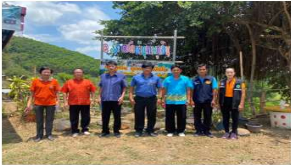
ภาพที่ ๖ ร่วมประชุมเตรียมการรับเสด็จสมเด็จพระเทพฯ โครงการอาหารกลางวัน ในวันที่ ๑๑ พฤษภาคม ๒๕๖๖ ณ โรงเรียนตำรวจตระเวนชายแดนบ้านห้วยเทพภูเงิน ตำบลน้ำโสม อำเภอน้ำโสม จังหวัดอุดรธานี