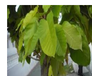
ภาพที่ 2.5 ต้นไม้ประจำจังหวัด

5) คำขวัญจังหวัด “กรมหลวงประจักษ์สร้างเมือง ลือเลื่องแหล่งธรรมะอารยธรรมห้าพันปี ธานีผ้าหมี่ขิดธรรมชาติเนรมิต ทะเลบัวแดง แรงศรัทธาศรีสุทโธ ปทุมมาคำชะโนด”