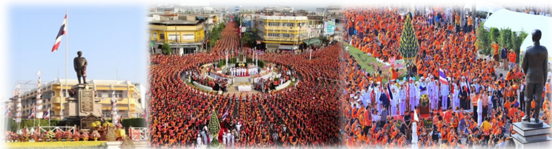
ภาพที่ 2.1 วันรำลึกวันก่อตั้งเมืองอุดรธานี

จังหวัดอุดรธานี ตั้งขึ้นเมื่อปีพ.ศ.2436 (ร.ศ.112) มีการจัดบันทึกไว้ในช่วงรัชกาลที่ 5 แห่งกรุงรัตนโกสินทร์ เนื่องจากพลตรีพระเจ้าบรมวงศ์เธอกรมหลวงประจักษ์ฯ ทรงย้ายกองบัญชาการมณฑลลาวพวนเมืองหนองคาย จากเหตุ “กรณีพิพาท ร.ศ. 112 ”มายังบ้านเดื่อหมากแข้งตำบลหมากแข้ง จังหวัดอุดรธานี พลตรีพระเจ้าบรมวงศ์เธอกรมหลวงประจักษ์ศิลปาคม ผู้สำเร็จราชการแทนพระองค์ในมณฑลลาวพวน ซึ่งในขณะนั้นตั้งกองกำลังทหารอยู่ ณ เมืองหนองคาย ได้รับสั่งให้พระยอดเมืองขวางเจ้าเมืองคำม่วน-คำเกิดออกไปสอดส่องดูแลตรวจตราพื้นที่ ในพระราชอาณาเขต เพื่อให้ฝรั่งเศสรุกล้ำเข้ามาในดินแดนของสยามประเทศ เนื่องจากประเทศฝรั่งเศสมีการล่าอาณานิคมแถบอินโดจีน นำโดย ม.ปาวีหุตฝรั่งเศส ได้ปักธงมาเรื่อย ๆ และล้ำเข้ามาในพระราชอาณาเขตแผ่นดินสยามประเทศ