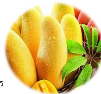
ภาพที่ 2.10 มะม่วงน้ำดอกไม้สีทอง

มะม่วงน้ำดอกไม้สีทอง มีลักษณะผลดิบสีเขียวจนลพอายุ 2-3 เดือนผิวผลเปลี่ยนเป็นสีเหลืองอ่อน ผลแก่จะสีเขียวอมเหลือง ผลสุกเหลืองทอง มีเปลือกหนากว่าน้ำดอกไม้ทั่วไป ความหนาของเปลือกวัดได้ 0.17-0.19 เซนติเมตร ขนาดผล มีน้ำหนักผลเฉลี่ยประมาณ 350 กรัม ความกว้าง 7.2 เซนติเมตร ความยาว 14.8 เซนติเมตร หนา 6.4 เซนติเมตร มีส่วนเนื้อมากถึง