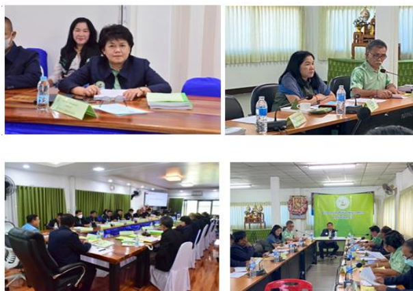
ภาพที่ ๔ การสนับสนุนการดำเนินงานให้ความช่วยเหลือเกษตรกรด้านหนี้สินของสำนักงานกองทุนฟื้นฟูและพัฒนาเกษตรกร

๖.๒.๒.๖ ข้อเสนอแนะ ควรมีมาตรการให้ความช่วยเหลือลูกหนี้ที่มีบุคคลค้ำประกัน