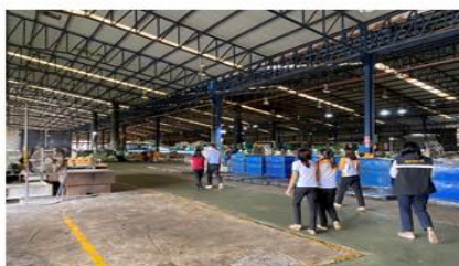
ภาพที่ ๕ การดำเนินงานการแก้ไขปัญหาข้อร้องเรียนเรื่องกลิ่นจากโรงงานผลิตยางพารา ที่มา : กลุ่มช่วยเหลือเกษตรกรและโครงการพิเศษ สำนักงานเกษตรและสหกรณ์จังหวัดอุดรธานี (๒๕๖๖)