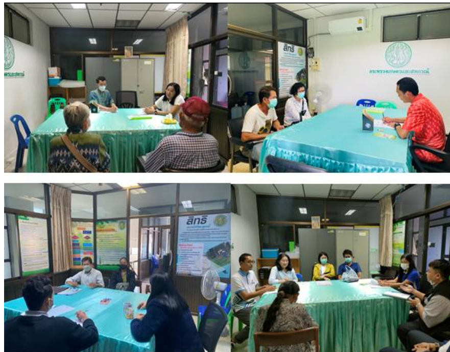
ภาพที่ ๓ การดำเนินงานกองทุนหมุนเวียนเพื่อการช่วยเหลือเกษตรกรและผู้ยากจน (อบก.) ส่วนจังหวัดอุดรธานี

๖.๒.๒ การสนับสนุนการดำเนินงานให้ความช่วยเหลือเกษตรกรด้านหนี้สินของสำนักงานกองทุนฟื้นฟูและพัฒนาเกษตรกร ช่วยเหลือเกษตรกรด้านหนี้สินของสมาชิกกองทุนฟื้นฟูและพัฒนาเกษตรกร ตามแนวทางการแก้ไขหนี้ตาม มติ ครม. เมื่อวันที่ ๒ ตุลาคม ๒๕๖๑ ดังนี้