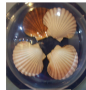
แหล่งที่มาของความคิด