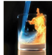
แหล่งที่มาของความคิด