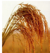
แหล่งที่มาของความคิด