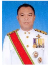
จำเอกเฉลิมพล ญาณวิสุทธิสกุล เกษตรและสหกรณ์จังหวัดยะลา