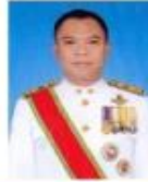
เจ้าเอกเฉลิมพล ฐานวิสุทธิสกุล เกษตรและสหกรณ์จังหวัดยะลา