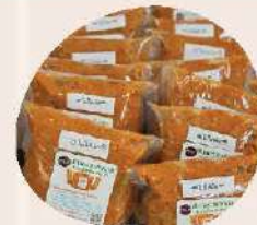
ทอดมันปลากราย