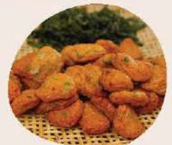
ทอดมันปลากราย (สุกพร้อมทาน)