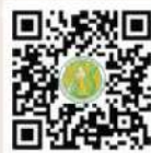
ภัตาคารบ้านทุ่ง