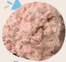
เนื้อปลากรายขูด