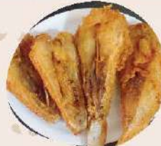
เงี่ยงปลากราย