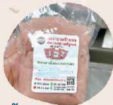
เนื้อปลากรายปรุงรส (ขวดแฉะ)