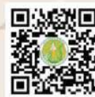
ปลากราย 5 G