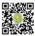
หม่อมมณีดแอค