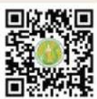
ดิ่งพริกดิ่งบิง