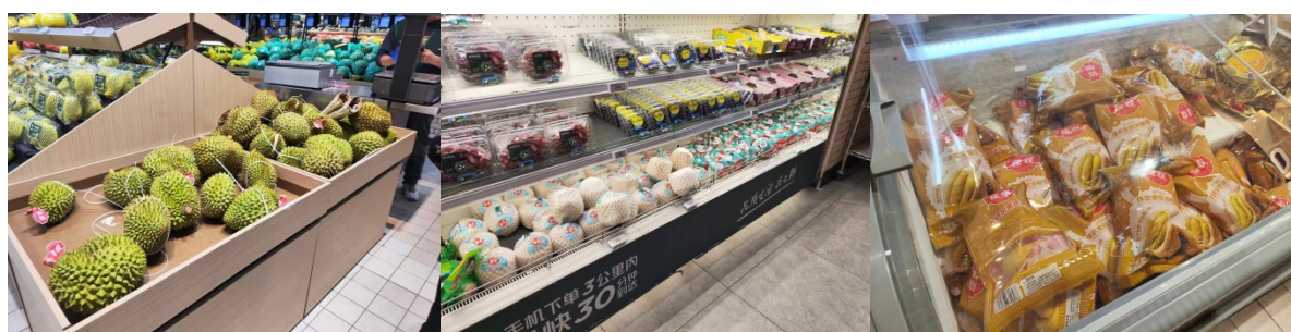
รูปภาพผลไม้ที่ขายในซูเปอร์มาร์เก็ต 7 Fresh ณ กรุงปักกิ่ง

จากการสำรวจราคาผลไม้จากร้านค้าขายปลีก ซูเปอร์มาร์เก็ต/ออนไลน์ในปักกิ่ง จาก Hema, 7Fresh และ Meituan พบว่า มีการจำหน่ายผลไม้ที่นำเข้ามาจากไทย ได้แก่ ทุเรียนหมอนทองสดและแช่แข็ง มะพร้าว ส้มโอ และลำไย จากการสอบถามพนักงานขายทราบว่า ทุเรียนและมะพร้าวไทยถือว่าเป็นผลไม้ยอดฮิตที่มียอดขายต่อวันในปริมาณมาก โดยเฉพาะทุเรียนสดของไทย ช่วงเช้ามีการวางจำหน่ายเต็มภาคแต่พอเช้าช่วงบ่ายทุเรียนเหล่านี้ได้ขายออกไปเป็นจำนวนมาก