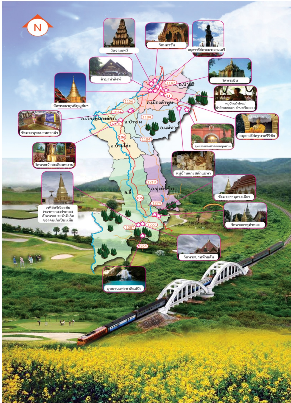
แผนภาพที่ 2 แผนที่แสดงแหล่งท่องเที่ยวในจังหวัดลำพูน