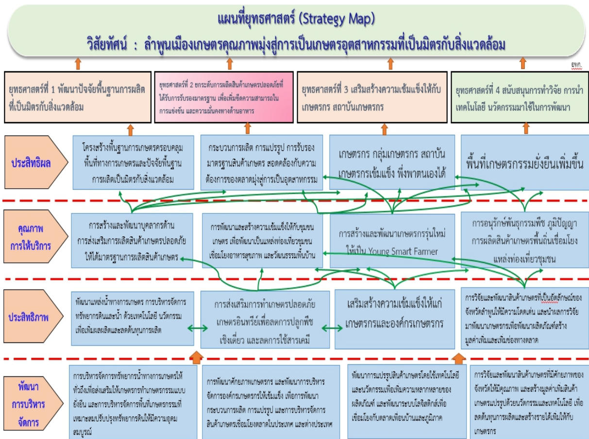
แผนภาพที่ 4 แผนที่ยุทธศาสตร์ (Strategy Map)

กลยุทธ์ที่ 1 การขยายผลการวิจัย นวัตกรรม เทคโนโลยีทางการเกษตรมาใช้ในพื้นที่