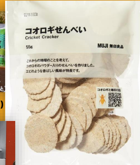
แครกเกอร์ (MUJI, Toshima City, TOKYO)