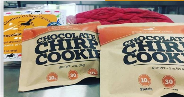
คุกกี้จิ้งหรีด (Cowboy Cricket Farms, Montana)