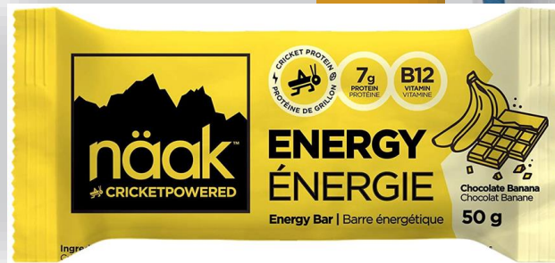
Energy Bar (Nääk, Montreal)