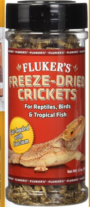
อาหารสัตว์เลี้ยงจิ้งหรีด Freeze-dried (Fluker's Cricket Farms, Los Angeles)