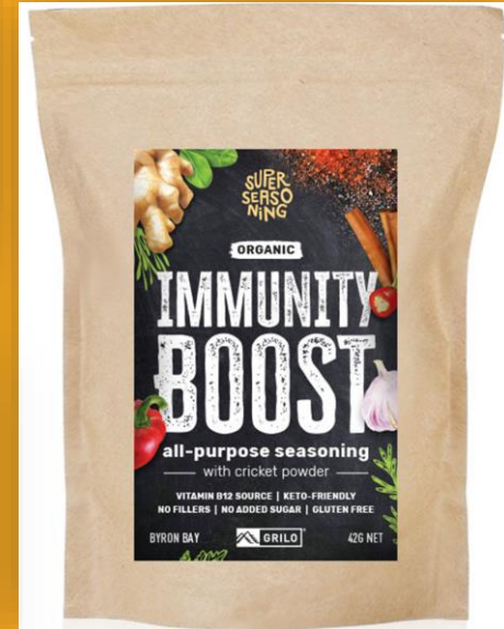
ผงปรุงรส (Grilo, New South Wales)