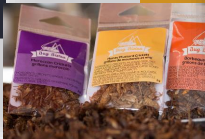
จิ้งหรีดปรุงรส (Entomo Farms, Ontario)