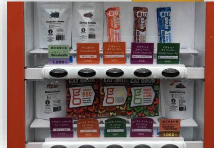
ตู้ขายสินค้าอัตโนมัติ