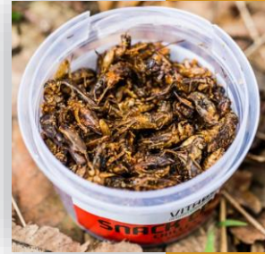
ขนมขบเคี้ยว (Circle Harvest, New South Wales)