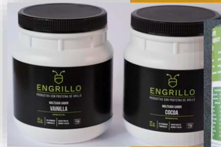
ผงโปรตีน (EnGrillo)