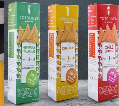
tortilla chips (Griyum)