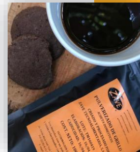
คุกกี้ (GIIGA MX, Veracruz)