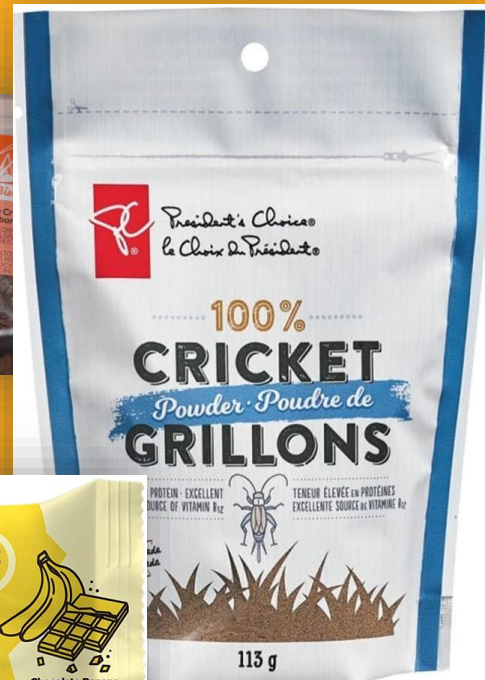
ผงจิ้งหรีดแบบซอง (President's Choice, Ontario)