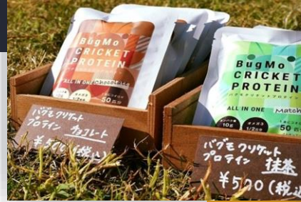
protein bar (BugMo Co., Kamigyo Ward)