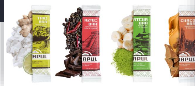
cricket protein bar (Chapul Farms, Utah)