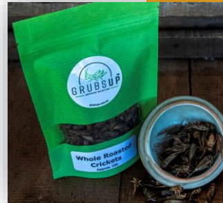
จิ้งหรีดคั่ว (Grubs Up Australia, Western Australia)