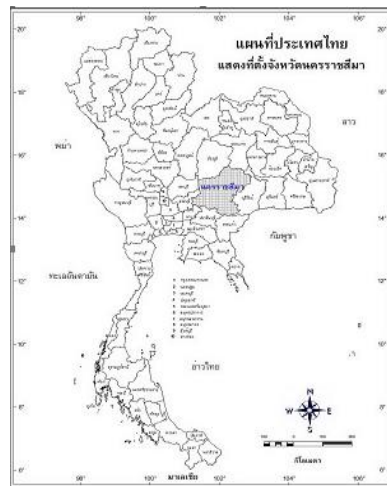
รูปภาพที่ 1 แสดงที่ตั้งจังหวัดนครราชสีมา

จังหวัดนครราชสีมาตั้งอยู่ในภาคตะวันออกเฉียงเหนือและอยู่ในพื้นที่กลุ่มจังหวัดภาคตะวันออกเฉียงเหนือตอนล่าง 1 บนที่ราบสูงโคราชละติจูด 15 องศาเหนือลองจิจูด 102 องศาตะวันออกสูงจากระดับน้ำทะเลปานกลาง 187 เมตร ตัวจังหวัดอยู่ห่างจากกรุงเทพมหานครโดยทางรถยนต์ 259 กิโลเมตร และโดยทางรถไฟ 264 กิโลเมตร