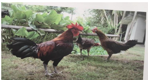
ไก่แม่ฮ่องสอน

ลักษณะประจำพันธุ์ มีขนลำตัว-หางสีดำ สร้อยคอ-หลังสีเหลืองเข้ม มีปุยขาวที่โคนหาง หงอนจักร แข้ง-ปากสีดำหรือเทา ผิวหนังขาวอมแดง ผลผลิตไข่ 81 ฟอง/แม่/ปี