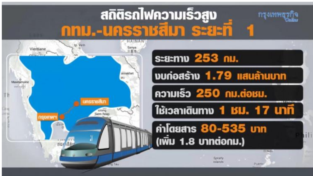
รูปภาพแสดงรถไฟความเร็วสูง

รถไฟความเร็วสูงสายแรกกรุงเทพฯ-นครราชสีมา-หนองคาย ภายใต้ความร่วมมือกับสาธารณรัฐประชาชนจีน ระยะทาง ๖๑๗ กม. แบ่งเป็น ๒ ช่วง ช่วงที่ ๑ (กทม. - โคราช) ระยะทาง ๒๕๒.๕ กม. งบประมาณ ๑.๗๙ แสนล้านบาท เปิดให้บริการ พ.ศ. ๒๕๖๖ ช่วงที่ ๒ (โคราช - หนองคาย) ระยะทาง ๓๕๕ กม. งบประมาณ ๒.๑ แสนล้านบาท เปิดให้บริการ พ.ศ. ๒๕๖๙