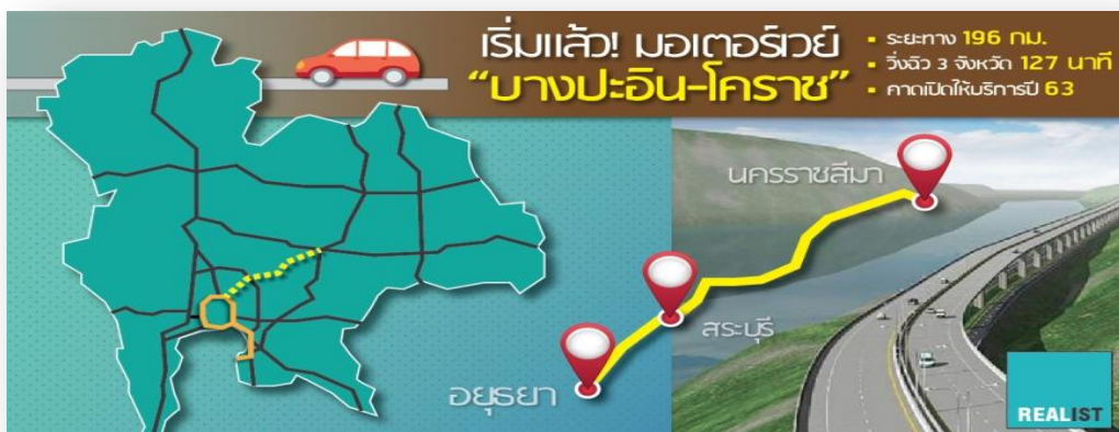
รูปภาพแสดงเส้นทางถนนมอเตอร์เวย์

๑) โครงการก่อสร้างทางหลวงพิเศษระหว่างเมืองหมายเลข ๖ สายบางปะอิน – สระบุรี – นครราชสีมา การก่อสร้างแบ่งออกเป็น ๒ ช่วง ๒๐ โครงการ แล้วเสร็จ ๑๐ โครงการ ระยะทาง ๒๕.๔๓๐ กม. คงเหลือยังไม่แล้วเสร็จ ๑๐ โครงการ ระยะทาง ๘๔.๖๓๗ กม. ความคืบหน้าเฉลี่ย ๙๒% คาดว่าดำเนินการก่อสร้างแล้วเสร็จภายในปี พ. ศ. ๒๕๖๕