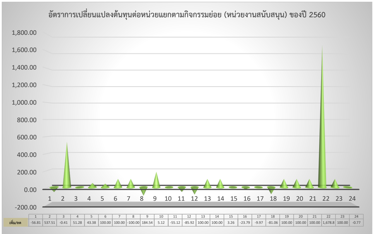
ภาพแสดงการเปรียบเทียบอัตราการเปลี่ยนแปลงต้นทุนต่อหน่วยแยกตามกิจกรรมย่อย (หน่วยงานสนับสนุน) ของปี ๒๕๖๐

ในระดับกิจกรรมย่อย ของหน่วยงานสนับสนุน พบว่า ในปีงบประมาณ พ.ศ. ๒๕๕๙ สำนักงานปลัดกระทรวงเกษตรและสหกรณ์ มี ๑๖ กิจกรรมย่อย และในปีงบประมาณ พ.ศ. ๒๕๖๐ มี ๒๓ กิจกรรมย่อย ซึ่งในปีงบประมาณ พ.ศ. ๒๕๖๐ กิจกรรมย่อยที่ ๖ – ๘ กิจกรรมย่อยที่ ๑๓ – ๑๔ กิจกรรมย่อยที่ ๑๙ -๒๑ และกิจกรรมย่อยที่ ๒๓ ไม่สามารถเปรียบเทียบได้ เนื่องจากไม่ได้กำหนดกิจกรรมย่อยดังกล่าว สำหรับกิจกรรมย่อยที่ ๒๒ คือ กิจกรรมด้านวินัยและความรับผิดชอบทางละเมิด มีต้นทุนต่อหน่วยสูงสุด ร้อยละ ๑,๖๗๘.๘๗ (๐.๐๗ ล้านบาท) เนื่องจากในปีงบประมาณ พ.ศ. ๒๕๖๐ หน่วยงานได้กำหนดกิจกรรมย่อยเป็น ๒ กิจกรรม แต่ในปีงบประมาณ พ.ศ. ๒๕๕๙ กำหนดกิจกรรมย่อยเป็น ๑ กิจกรรม จึงทำให้จำนวนหน่วยนับในปีงบประมาณ พ.ศ. ๒๕๖๐ ลดลงส่งผลให้ต้นทุนต่อหน่วยเพิ่มขึ้น รองมาคือกิจกรรมย่อยที่ ๒ คือ กิจกรรมสนับสนุนการปฏิบัติงานของ ค.ต.ป. ประจำกระทรวง มีต้นทุนต่อหน่วยเพิ่มขึ้น ร้อยละ ๕๓๗.๕๑ (๐.๒๕ ล้านบาท) เนื่องจากปีงบประมาณ พ.ศ. ๒๕๕๙ คณะกรรมการ ค.ต.ป. ได้มีการจัดประชุมหารือเพิ่มเติมจากปกติเดือนละ ๑ ครั้ง และในปีงบประมาณ ๒๕๖๐ มีแผนเริ่มตรวจติดตามตั้งแต่เดือนมกราคม ๒๕๖๐ จึงทำให้การลงพื้นที่ที่ตรวจติดตามและประเมินมีจำนวนลดลงจากปี ๒๕๕๙ พร้อมทั้งกิจกรรมย่อยที่ ๑๒ คือ กิจกรรมด้านการพัสดุ มีต้นทุนต่อหน่วยลดลงสูงสุด ร้อยละ ๘๕.๙๒ (๐.๐๓ ล้านบาท) เนื่องจากในปีงบประมาณ พ.ศ. ๒๕๕๙ กองคลังได้นำเงินกองทุนหมุนเวียนเพื่อการกู้ยืมแก่เกษตรกรและผู้ยากจนที่ให้เกษตรกรกู้ยืมมาเป็นต้นทุนของกองคลัง แต่ในปีงบประมาณ ๒๕๖๐ จำนวนเงินที่ปล่อยให้เกษตรกรกู้ยืมไม่นำมาคำนวณเป็นต้นทุนของ สป.กษ.