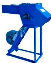
เครื่องสับหญ้า-กล้วย