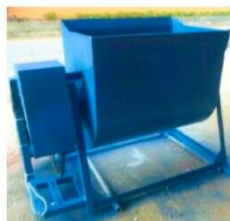
เครื่องผสม