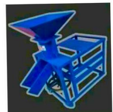
เครื่องอัดเม็ด