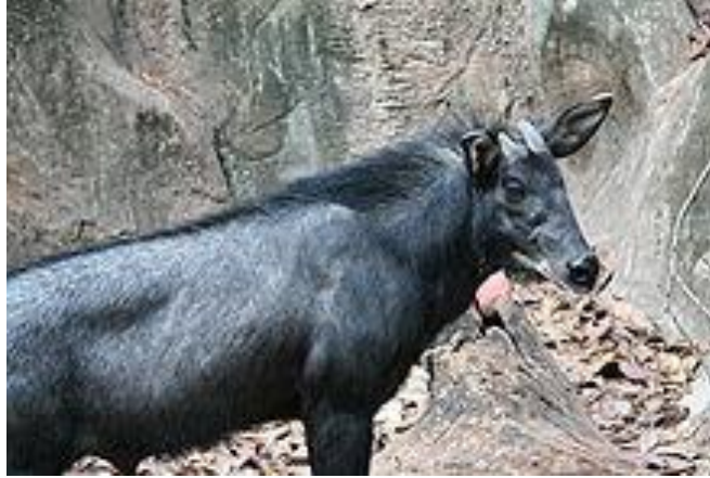
Serow Capricornis sumatraensis.JPG