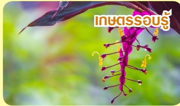
กะต้อบรู๋