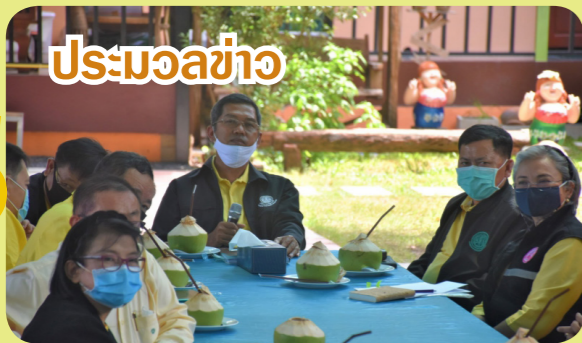
โปรโมชั่น