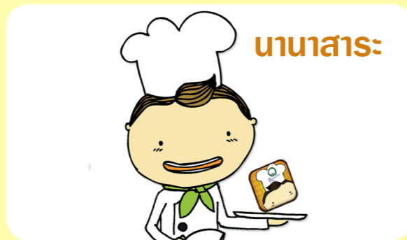
บานาสาระ