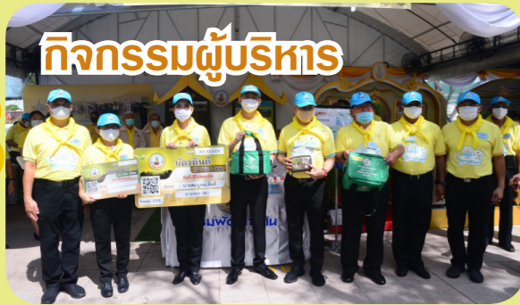
กิจกรรมผู้บริหาร