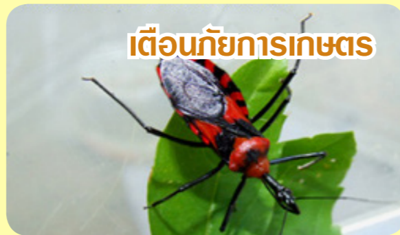
เตือนภัยการเกษตร