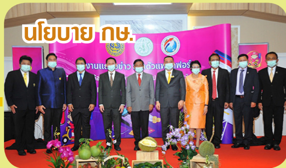
นโยบาย กษ.