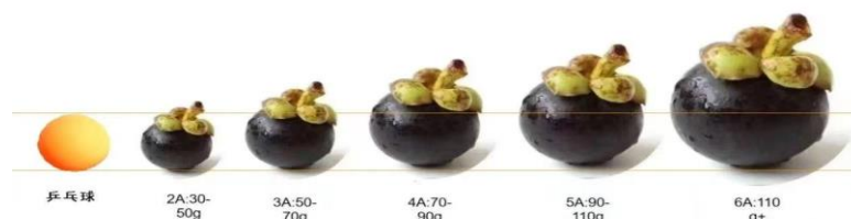
เกรดมังคุดจาก 2A -6A