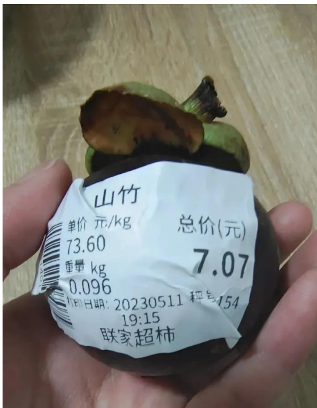
ราคามังคุดลูกละ 7.07 หยวน (35 บาท) กิโลกรัมละ 73.6 หยวน (368 บาท) เมื่อ 11 พ.ค. 66