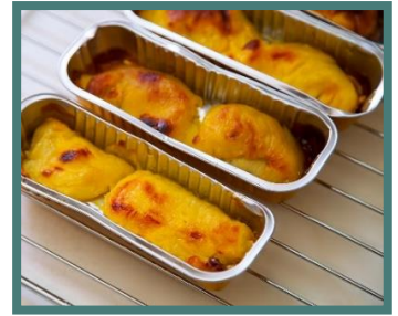
ทุเรียนย่าง

ขยายตลาดทุเรียนในจีนด้วยการสร้างแบรนด์ จีนเป็นประเทศที่มีประชากรมากเป็นอันดับต้นของโลก ผนวกกับเศรษฐกิจภายในประเทศที่แข็งแกร่ง ตลาดผู้บริโภคจีนจึงมีขนาดใหญ่และมีกำลังซื้อสูง ตลาดทุเรียนในจีนจึงยังสามารถเติบโตขึ้นได้อีกมาก โดยปัจจุบันชาวจีนค่อนข้างให้ความสำคัญกับเรื่องสุขภาพเป็นสำคัญ การเลือกซื้ออาหารจะคำนึงถึงคุณภาพเป็นหลัก ทุเรียนไทยนั้นมีข้อได้เปรียบในเรื่องคุณภาพ แม้จะมีราคาสูงกว่าทุเรียนเวียดนาม แต่ก็มีผู้ที่ยอมจ่ายเพื่อทานผลไม้ที่คุณภาพดีกว่า ดังนั้น การรักษาคุณภาพทุเรียนไทยให้คงที่และมีมาตรฐานอยู่เสมอเป็นสิ่งจำเป็นในการครองอันดับหนึ่งในการส่งออกทุเรียนไปจีนอย่างยั่งยืน