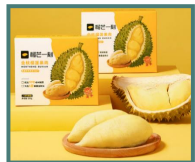
ตัวอย่างแบรนด์ทุเรียนในจีน