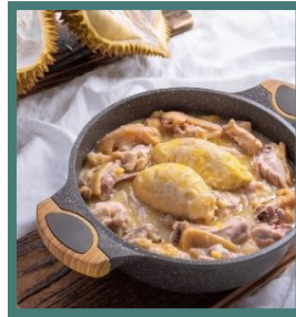
ซุปไก่ทุเรียน