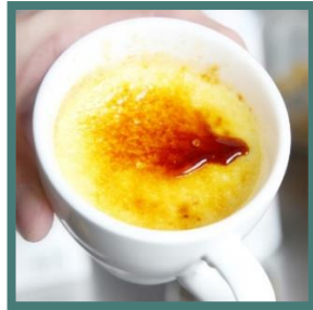
พุดดิ้งเนื้อทุเรียน