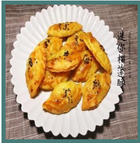
พายไส้เนื้อทุเรียน

หลายคนอาจจะยังไม่รู้ว่าชาวจีนมีวิธิตานทุเรียนที่หลากหลาย ชาวจีนเป็นนักคิดและนักสร้างสรรค์ ในหลายๆ ด้าน ทุเรียนเป็นผลไม้ที่ชาวจีนชื่นชอบก็ถูกนำมาสร้างสรรค์ด้วยเช่นกัน เมนูที่ค่อนข้างได้รับความนิยม เช่น ไอศกรีมเนื้อทุเรียน เนื้อทุเรียนย่าง พุดดิ้งเนื้อทุเรียน เนื้อทุเรียนชุบมะพร้าวทอดกรอบ พายไส้เนื้อทุเรียน เป็นต้น นอกจากนี้ชาวจีนยังเชื่อว่าเปลือกทุเรียนมีคุณค่าทางโภชนาการสูงจึงนำมาใช้ทำอาหารด้วย เช่น ซุปไก่ โดยจะใช้เปลือกทุเรียนมาต้มเป็นน้ำซุป จากนั้นใส่เนื้อทุเรียน เนื้อไก่ และเครื่องเทศต่างๆ ลงไป ซุปซี่โครงหมู ทุเรียน โดยจะหั่นเปลือกทุเรียนเป็นชิ้นเล็กๆ ลงไปต้มในน้ำซุป ข้าวหมกกลิ่นทุเรียน ซึ่งเมนูนี้จะเอาน้ำซุที่ได้จากการต้มเปลือกด้านในของทุเรียนที่มีสีขาวและเนื้อมาใช้ทำข้าวหมก