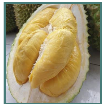
ทุเรียนไทย