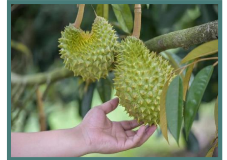
ทุเรียนไห่หนาน

ภาพรวมราคาทุเรียนในตลาดจีนในครึ่งแรกของปี 2566 (มกราคม-มิถุนายน) มีแนวโน้มดีขึ้น ในช่วงปลายปี 2565 - ต้นปี 2566 มีการคาดการณ์ว่าราคาทุเรียนจะลดต่ำลง เนื่องจากเมื่อเดือนตุลาคม 2565 เวียดนามได้รับอนุญาตให้ส่งออกทุเรียนสดมายังประเทศจีนอย่างเป็นทางการ ซึ่งในช่วงที่ทุเรียนไทยเข้าสู่ช่วงปลายฤดูกาล ตลาดมีสินค้าน้อยและทุเรียนจากเวียดนามจะเข้ามาทดแทนทุเรียนไทย โดยเฉพาะอย่างยิ่งในช่วงเดือนกันยายน - เดือนกุมภาพันธ์ในปีถัดมา แต่เดือนมกราคมปี 2566 เศรษฐกิจจีนฟื้นตัวดีขึ้น ผู้บริโภคมีกำลังซื้อมากขึ้น ส่งผลให้ปีนี้ราคาทุเรียนเพิ่มขึ้นร้อยละ 19.8 เมื่อเทียบกับปีที่แล้ว ต่างจากที่หลายคนคาดการณ์ไว้